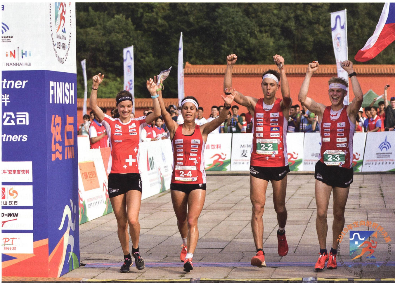
Die Schweizer Orientierungsläuferinnen und Orientierungsläufer gehören zu den erfolgreichsten Athleten des Militärsports. Rund ein Viertel aller Medaillen gehen auf ihr Konto.

gute technische Fähigkeiten wie das Kompasslaufen, die Geländeformen verstehen, korrekte Routenwahlentscheidungen treffen und das Navigieren mit Karte. Dazu braucht es viel Erfahrung in verschiedenen Geländearten.