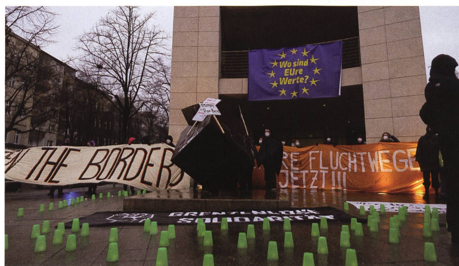
Der Konflikt zwischen dem belarussischen Staatschef Alexander Lukaschenko und der EU eskalierte bereits im Sommer 2021, breite mediale Berichterstattung dazu gab es aber erst im Herbst 2021.

Aus der Sicht der EU wurde dies gezielt von der belarussischen Regierung Lukaschenkos betrieben. Dieser hatte zuvor offen damit gedroht, als Reaktion auf die EU-Sanktionen Flüchtlinge aus Ländern wie dem Irak, Afghanistan und Syrien nach Polen passieren zu lassen. Lukaschenko war im August 2020 trotz massiver Vorwürfe wegen Wahlfälschung zum Wahlsieger erklärt worden, Massenproteste liess er mit Gewalt niederschlagen. Wegen der Unterdrückung der Zivilgesellschaft und der demokratischen Opposition verhängte die EU Anfang 2021 mehrfach Wirtschafts-