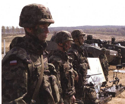
Mittlerweile verstärken 15000 polnische Soldaten den Grenzschutz und die Polizei an der Grenze zu Belarus.

Von Mitte Juli bis Ende Oktober 2021 untersuchten die Analysten dieser Firma die Aktivitäten arabischsprachiger Nutzer auf Facebook, Telegram, Twitter, Tiktok und Whatsapp und kamen zum Ergebnis, dass vor allem Facebook eine zentrale Rolle bei der Organisation der Routen Irak/Syrien/Afghanistan-Belarus-EU Migrationströme spielte. Dort entstanden