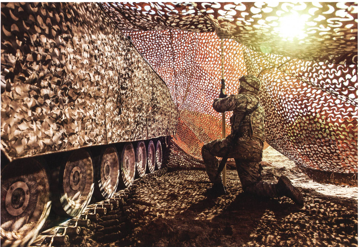
Blick von Innen: Ein Soldat baut das Barracuda Tarnsystem auf, um ein Fahrzeug zu tarnen.

Die bereitgestellte Technologie wird die Fähigkeit des Anwenders verbessern, auf dem Schlachtfeld unentdeckt zu bleiben, wo die Entwicklung immer leistungsfähigerer und besser zugänglicher Sen-