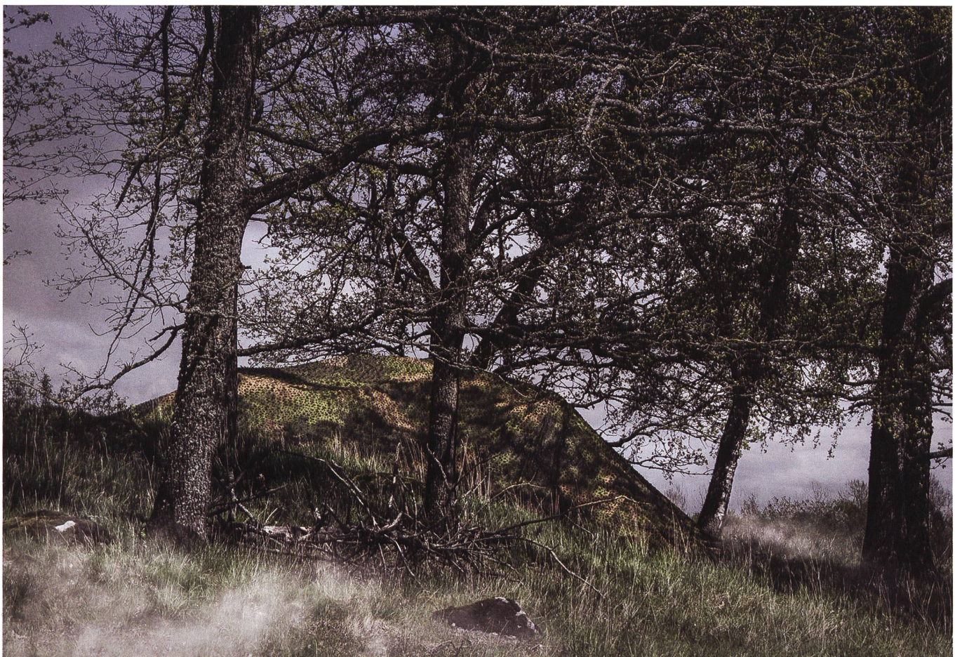
Ein Blick von Aussen: Das Das Tarnnetz ULCAS (Ultra-Lightweight Camouflage Screen) im Einsatz.