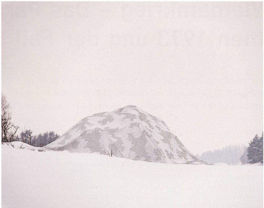
Einsatz im Winter: Mit dem multispektralen Tarnsystem werden auch thermische Signatur von Geräten oder Einrichtungen verschleiert und dem Hintergrund ähnlich macht.