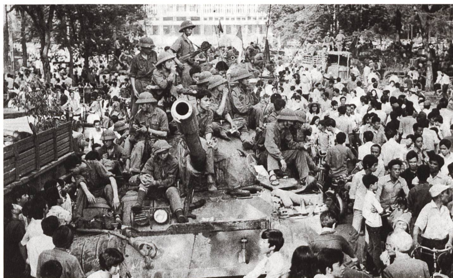
Strassenszene nach dem Fall von Saigon am 30. April 1975.