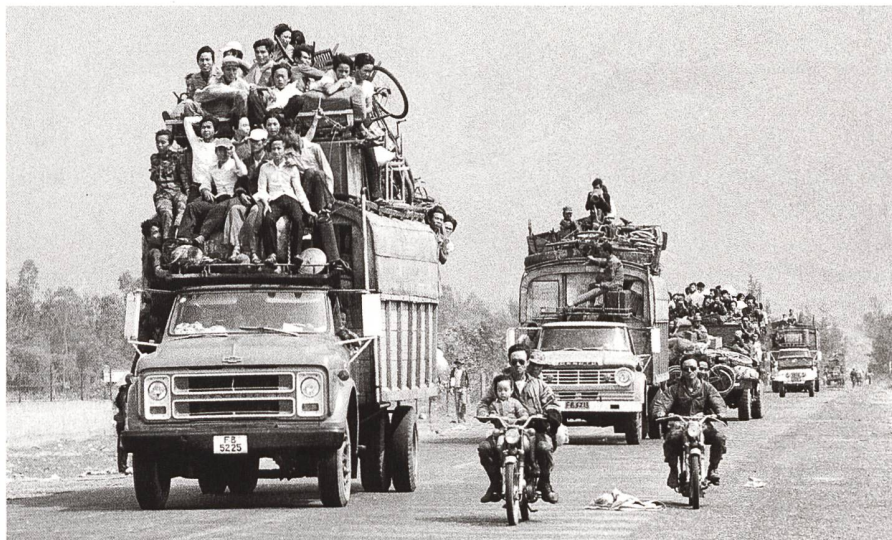
Frühjahr 1975, in Massen flüchten die Bewohner aus der Militärregion I (Region Da Nang) vor den anrückenden Kommunisten südwärts.