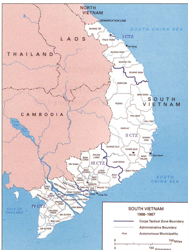
Die vier Militärregionen Südvietnams, im Norden an der DMZ die MR I mit Hue Da Nang und Chua Lai, dann die grosse MR II mit Nha Trang und Cam Ranh, die MR III mit Saigon und die MR IV mit dem Mekongdelta.