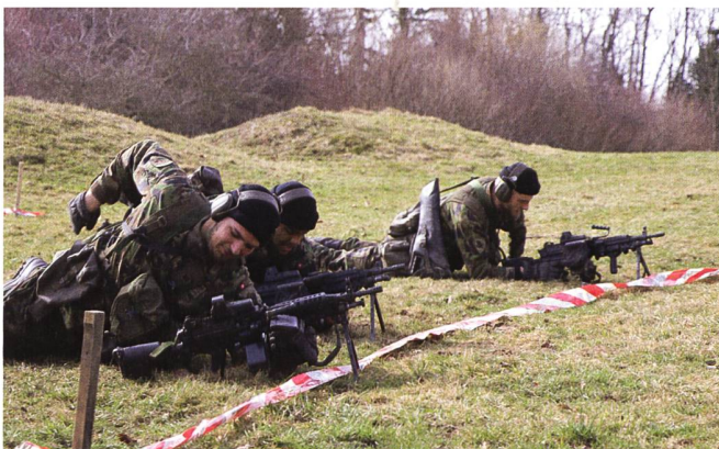
Auf der Drillpiste: Ausbildung am LMg.

Eine Infanterie-Gruppe besteht aus einem Gruppenführer sowie sieben Soldaten. Im Kampf kann sich diese Gruppe noch einmal aufteilen in zwei Trupps. Alpha und Bravo. Der Trupp Alpha wird dabei vom Gruppenführer (Wm) geleitet, während der Soldat mit der Spezialistenfunktion Truppchef den zweiten Trupp übernimmt. Die Soldaten in der Inf RS mit dieser Spe-