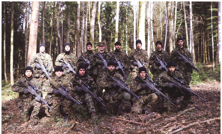
Die Truppführer-Spezialisten mit ihrem Gruppenführer.

Zwei grosse Zelte sind in Betrieb genommen worden. Eines funktioniert als Theorieraum/Speisesaal und das andere ist eine provisorische Turnhalle. Es stellt sich aber die Frage: Die Pandemie ist ja nicht erst gestern ausgebrochen. Warum mietet das Militär hier weiterhin zwei Zelte, anstatt diese zu kaufen? Branchenkenner wissen: Zeltmieten, insbesondere für grosse Zelte gehen ins Geld. Das Kommando Ausbildung sieht das nicht so: «Finanziell ist es fraglich, ob sich ein Kauf