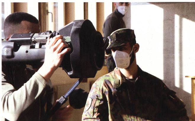
Und hier der Schütze, der von seinem Zugführer Tipps erhält.

Die Fahrer werden bereits an der Rekrutierung selektioniert und werden nach der Grundausbildung in die militärische Fahrschule