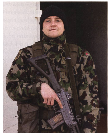
Wachtdienst: Während der Ausbildung wird der Sprengstoff mit scharfer Munition stets bewacht.

Das Beispiel der Infanterie Schule zeigt, dass sich die bisherigen Ausbildungskonzepte der Armee weiterhin bewähren. Das Kader und die Truppe sind sichtlich engagiert und motiviert bei der Sache und zeigen auch einen gewissen Stolz, dass sie diese Funktion ausüben können. Dass dies aber weiterhin möglich ist, ist auch Sache der Bundesverwaltung und der Stimmbürger. Insbesondere im Bereich Ausbildungsinfrastruktur und Unterkunft muss in der Zukunft auch die Infanterieschule 11 berücksichtigt werden. +