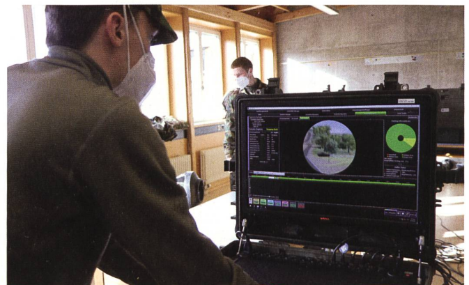
Simulator: Hier ist die Sicht des Schützen zu sehen.