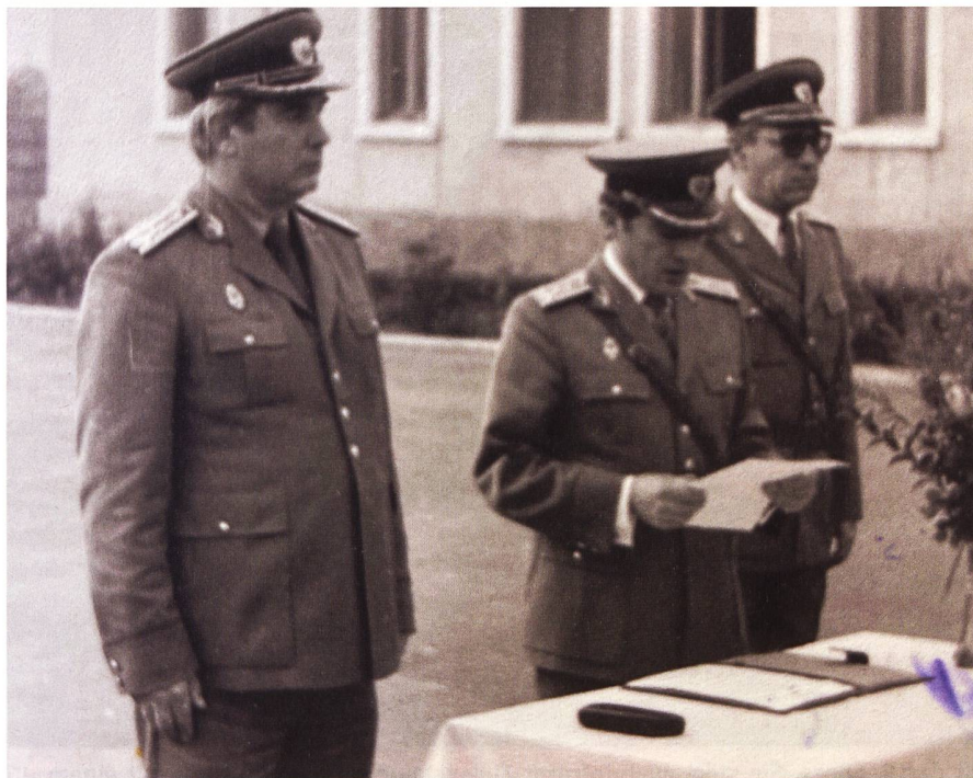
Bei der Beförderung.