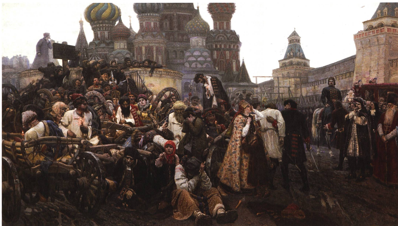
Der Aufstand der Strelizen im Juni 1698 unterbrach die diplomatische Mission im Ausland. Der Aufstand wurde brutal niedergeschlagen.

Das nächste Ziel der 200-köpfigen russischen Mission hiess Wien. Peter und Lefort, die inzwischen erfahren hatten,