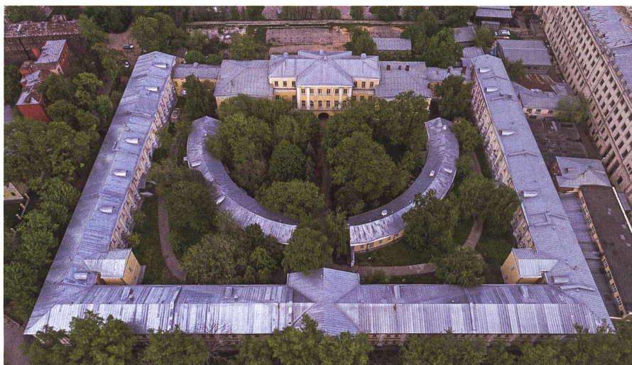
In seiner späten Zeit in Moskau lebte Lefort in einem Palast, der ihm von seinem Kaiser geschenkt worden war. Eine grosse Ehre, in einer Zeit, in der die meisten Bauten aus Holz erbaut wurden.

Daneben beteiligte er sich am Gericht über die Strelitzen und fand noch Zeit, um diplomatische Verhandlungen mit den ausländischen Gesandten zu führen und