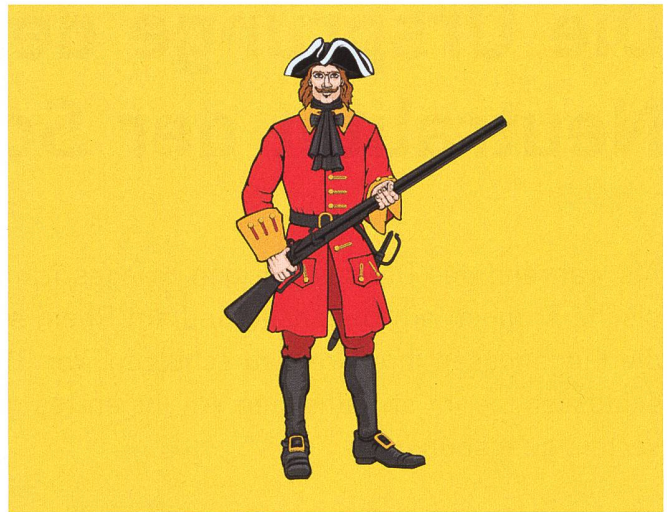
Das Wappen des Distrikts Lefortovo.

Er war überzeugter Raucher und nicht abgeneigt, dem Bacchus tüchtig zu huldigen.