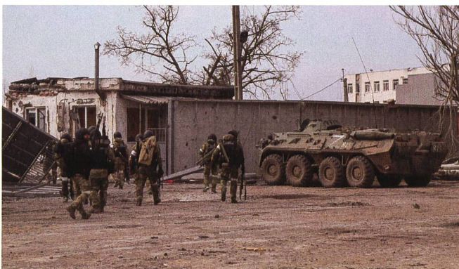
Russland führt das Gefecht streng hierarchisch. Der Verbund der Teilstreitkräfte funktioniert scheinbar nicht.

Funknetze der russischen Streitkräfte werden aufgeklärt. Dann erfolgen Überfäll-