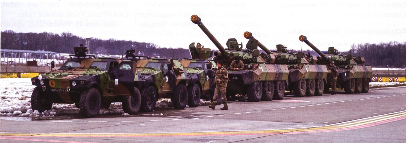
Per 16. März 2022 befinden sich an der NATO-Ostflanke 40 000 Streitkräfteangehörige unter direktem NATO-Kommando. Im Bild: französische Truppen.

Per 16. März 2022 befinden sich an der NATO-Ostflanke 40 000 Streitkräfte-Angehörige unter direktem NATO-Kommando, stehen 130 NATO-Kampfflugzeuge in hoher Bereitschaft, befinden sich 140 Schiffe unter NATO-Kommando auf See und die USA haben bisher 100 000 Soldaten nach Europa verlegt. +