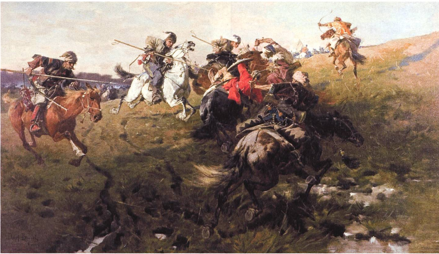
Der Zankapfel Krim war erst osmanisch/tatarisch, seit 1774 russisch und erst seit 1954 Bestandteil der Ukraine. Im Bild: Kosaken bekämpfen Tartaren des Khanat der Krimtataren.