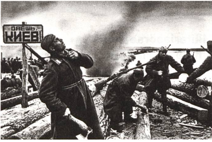
Die Schlacht am Dnjepr, 1943: Sowjetische Soldaten bereiten die Überquerung des Dnjepr mit Flößen vor (auf dem Schild steht «Nach Kiew!»).

kommunistischen Ministerpräsidenten. Ein weiterer Schritt war die Erklärung des Vorranges der Republik-Gesetze gegenüber denjenigen der Union. In einem Referendum vom März 1991 sprachen sich 70 Prozent der ukrainischen Stimmbürger für die Erhaltung der Sowjetunion aus, aber 80 Prozent bejahten gleichzeitig die nur der Ukraine gestellte Frage, dass die Ukraine Bestandteil einer Union souveräner Staaten auf den Prinzipien der Souveränitätserklärung sein solle.