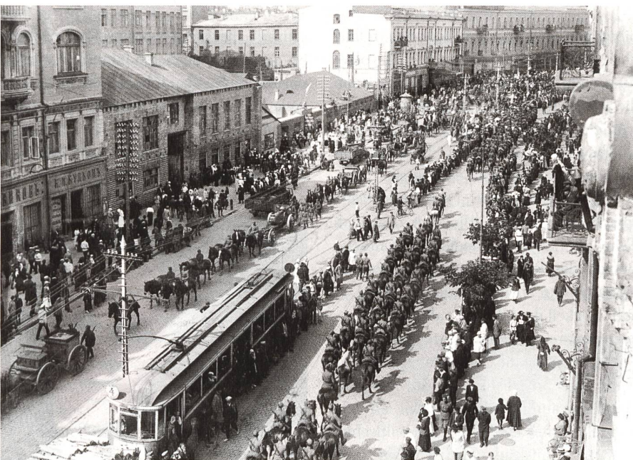
Polnische Truppen marschieren im Mai 1920 während des Polnisch-Sowjetischen Krieges in Kiew ein, in dem sich die Ukrainer auf die Seite Polens gegen die Bolschewiki stellten.

Die Ukraine hat das zu liefern, was Deutschland fehlt.» Die rechtsextremen Milizverbände spielten 2014–2022 wieder eine zentrale Rolle.