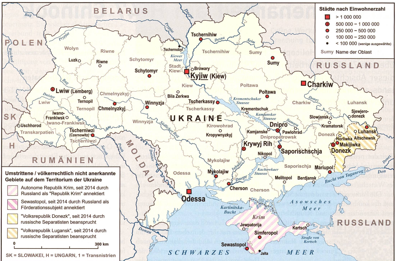
Das heutige ukrainische Territorium liegt zwischen den Karpaten im Westen, den Pripjet-Sümpfen im Norden, der zentralrussischen Platte im Osten und dem Schwarzen bzw. Asowsche-Meer im Süden.

Dabei ist die Bevölkerung der Ukraine bunt gemischt wie: Ukrainer, Russen, Belarussen, Rumänen, Ungarn, Slowaken,