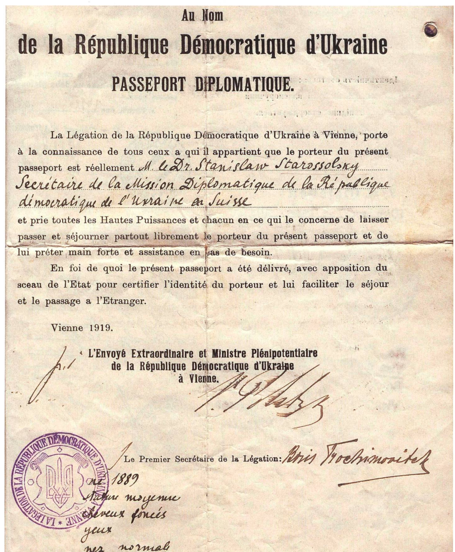
1917: Erste Unabhängige Regierung- wenn auch nur für kurze Zeit. Im Bild: Ein diplomatischer Pass eines ukrainischen Gesandten für den Dienst in der Schweiz.