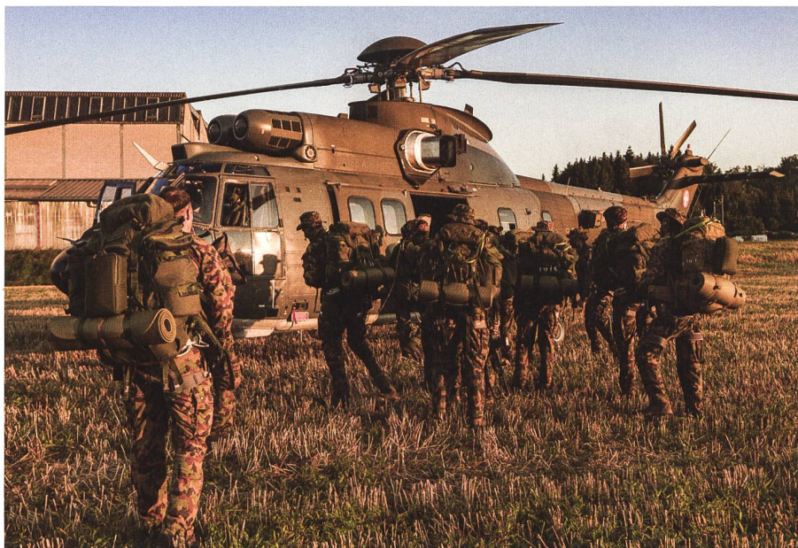
Mit Unterstützung der Luftwaffe zum Ziel und zum Erfolg.

und dabei aus gemachten Fehlern zu lernen. Ein Urlaubs- und Absenzenmanagement in einem 24-Stunden-Betrieb über drei Wochenenden ist ungleich fordernder als in einem klassischen Kasernenbetrieb.