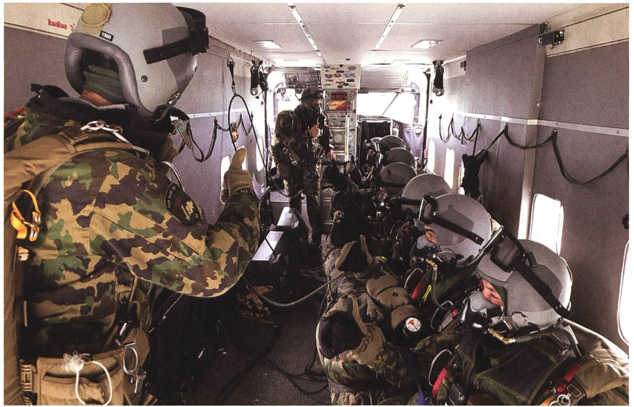
Aus der Luft ins Zielgebiet.

Beim involvierten Richtstrahl-Bataillon ist vor allem die Vorbereitung im Fokus. Das Sicherstellen der Verbindungen dort, wo der Kommandant mit seinen Elementen sprechen will. Angenehm fällt dem