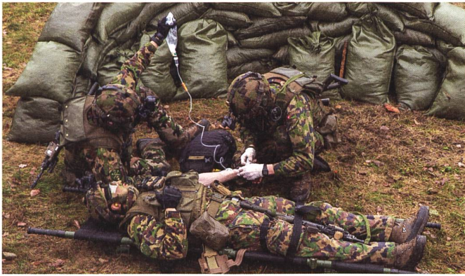
Sanitätsspezialist bei der Arbeit.