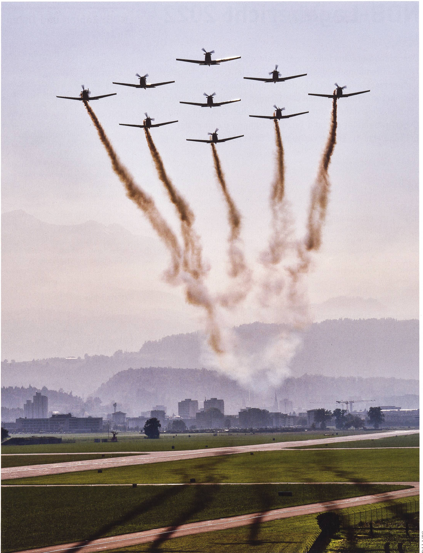
Das PC-7 Team im Formationsflug.