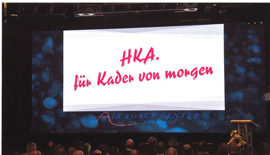
«Digitalisierung und Bildung» standen im Zentrum des diesjährigen Jahresrapportes der HKA.

Einen Tag vor dem Shutdown der Skyguide und dem temporären Grounding aller Flugbewegungen am Flughafen Zürich-Kloten ging es am Jahresrapport der Höheren Kaderausbildung der Armee HKA darum, ob und wie die Digitalisierung ihren Platz in der Armee, aber auch in den öffentlichen Bildungseinrichtungen wie einer Pädagogischen Hochschule gefunden habe.