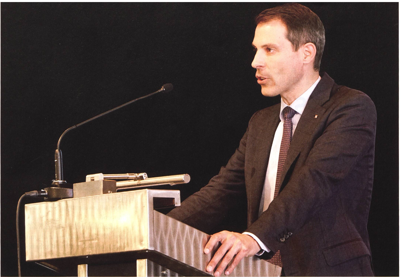
Thierry Burkart: Ständerat sowie Präsident Allianz Sicherheit Schweiz: «Wir sind heute mit einer Situation konfrontiert, die viele in Europa als überwunden geglaubt haben.»

Er wies dabei einleitend darauf hin, dass der Kauf der F-35 noch nicht in trockenen Tüchern sei. Für ihn ist es im übrigen klar, dass sich die Schweiz im Konfliktfall nicht auf den Schutz der Nachbarländer verlassen kann.