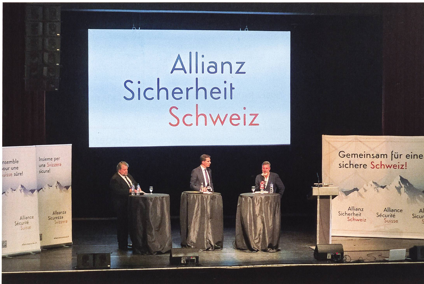
Vor einem Jahr wurde die Organisation Allianz Sicherheit Schweiz gegründet.

Im Anschluss an die Generalversammlung referierte der NZZ-Journalist Georg Hässler über die Konsequenzen für die Schweiz im Zusammenhang mit dem Krieg in der Ukraine.