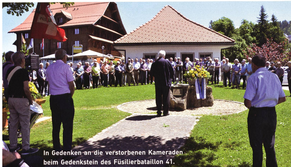
In Gedenken an die verstorbenen Kameraden beim Gedenkstein des Füsilierbataillon 41.