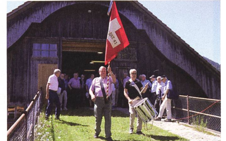
Nach zwanzig Jahren versammelten sich die Entlebucher Veteranen wieder unter ihrer Fahne.

«Militärisch und menschlich hatten wir es immer gut. Auch die Übungen mussten wir nur einmal absolvieren», erzählte einer der Soldaten. Die WKs in Dallenwil, in Steinbach bei Einsiedeln oder in Rüfenacht im Kanton Bern, nur um einige wenige zu nennen, hinterliessen viele bleibende Erlebnisse und Geschichten. So waren die