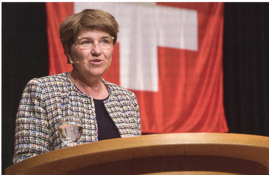
Bundesrätin Amherd: «Dieser Krieg wird mit zunehmender Brutalität geführt».

Die Chefin des Eidgenössischen Departements für Verteidigung, Bevölkerungsschutz und Sport war von der SVP Holziken zu einer Podiumsveranstaltung eingeladen worden. Das Thema: «F-35 - Sicherheit am Schweizer Himmel».