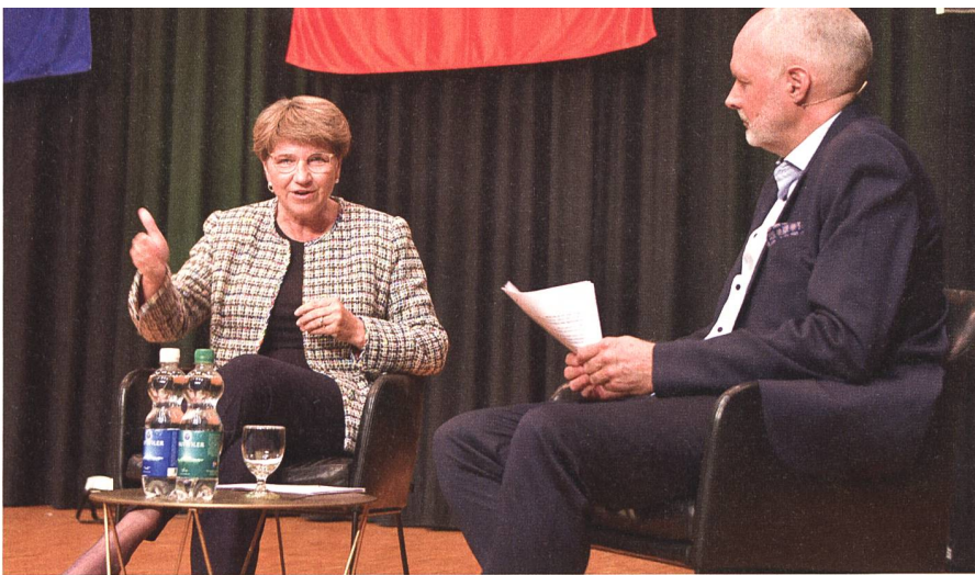
Zur Beschaffung von Kampffjets: «Wir können diese nicht einfach an der nächsten Ecke kaufen.»

tel der Armee richten sich nach den zur Verfügung stehenden Finanzen.»