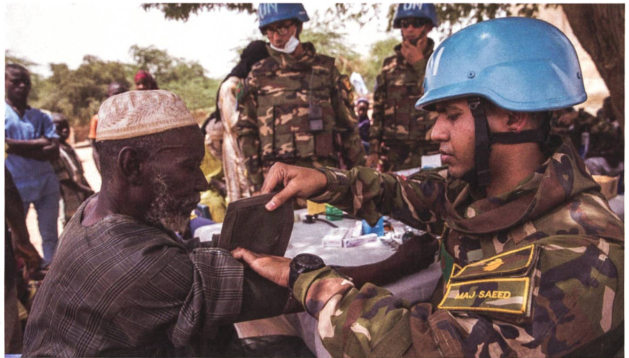
Der westafrikanische Staat Mali befindet sich seit 2012 in einer schweren politischen Krise, die Sicherheitslage ist extrem instabil.

Mali steht dabei im Zentrum der Terrorismusbekämpfung in Westafrika. Die Instabilität der Region hat unter anderem auch einen direkten Einfluss auf die Migration Richtung Europa.