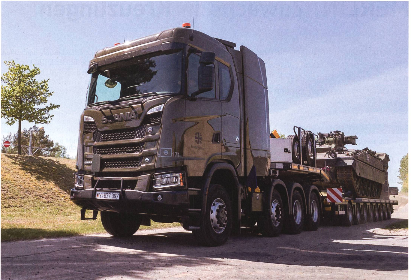
Das Joint Venture Unternehmen verlegt logistische Kapazitäten näher zu den NATO-Streitkräften in Litauen. Im Zentrum steht der Unterhalt der Gefechtsfahrzeuge.