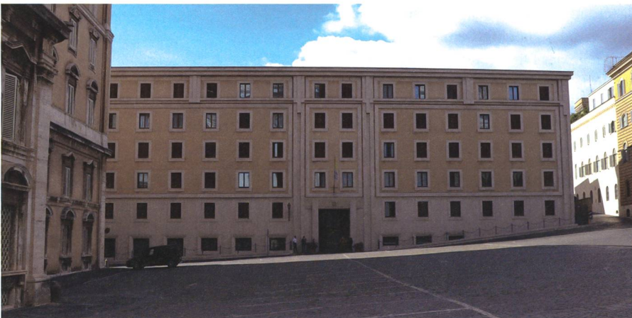
Papst Franziskus wohnt in der bisherigen Gästeresidenz des Vatikans. Der Eingang wird gemeinsam von der Garde und der Gendarmerie bewacht.

Beide Korps, Garde und Gendarmen, begleiten den Papst auf Auslandsreise.