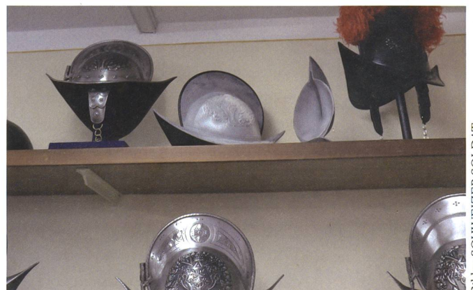
Neue Technologie: Seit neuestem werden die Helme aus Kunststoff mittels 3D-Druck massgefertigt. Dadurch kann man erstmals auch kleine Belüftungslöcher einbauen.