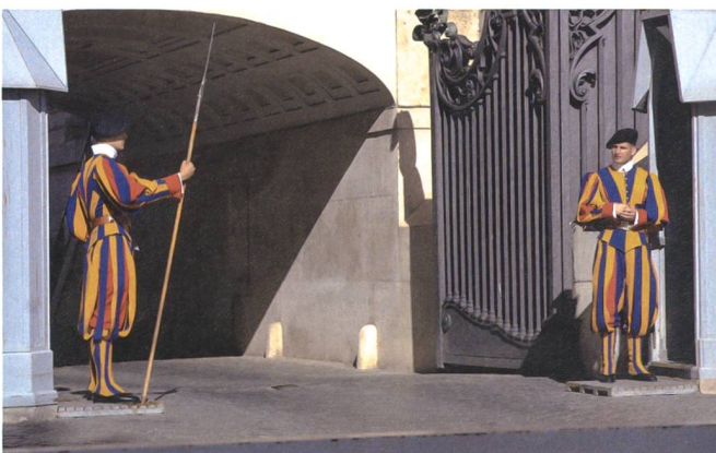
Die Schweizergarde hat verschiedene Aufträge. Hier im Bild der symbolische Dienst. Der wichtigste Auftrag ist jedoch der Schutz des Heiligen Vaters.