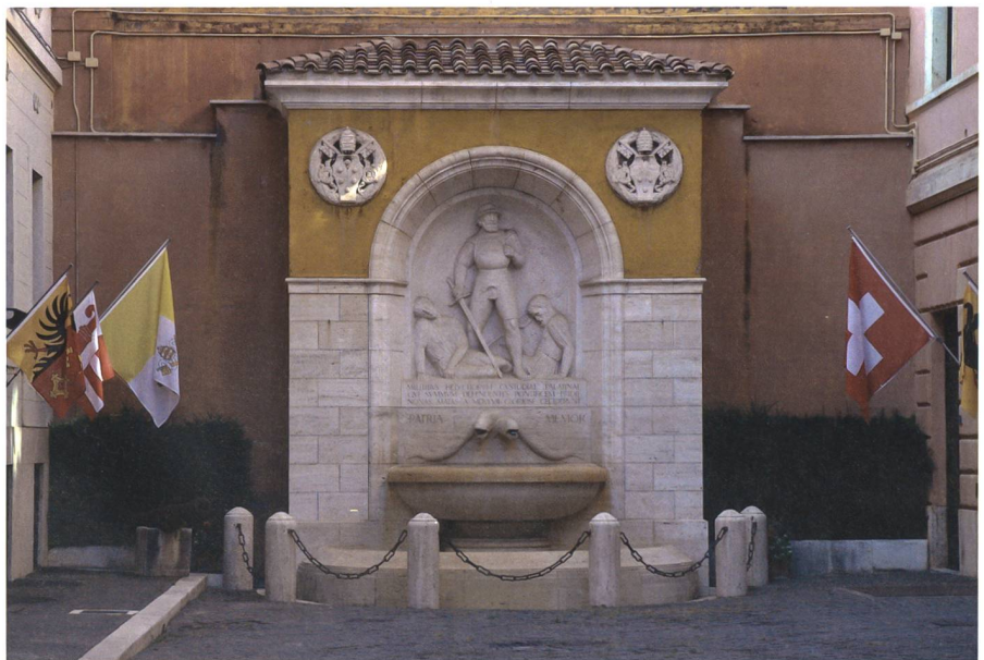
Im Innenhof des Schweizer Quartiers erinnert dieses zugemauerte Tor an die Verteidigung des Papstes während des Sacco di Roma 1527.

Somit bleibt die Garde in ihrer Kultur eine Truppe mit einem besonderen Zusammenhalt. Ob dieses Modell Zukunft hat, kann man nicht zuverlässig vorhersagen. Man kann es sich aber wünschen. +