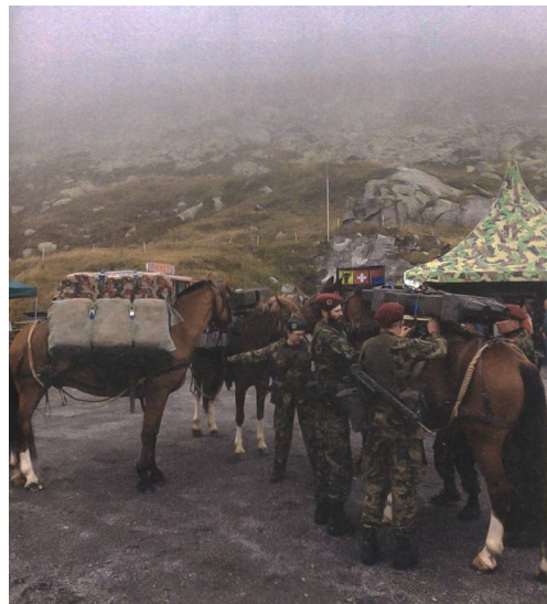
Mit von der Partie waren die Trainsoldaten der Schweizer Armee. Bei dichtem Nebel präsentierten sie ihr Können.