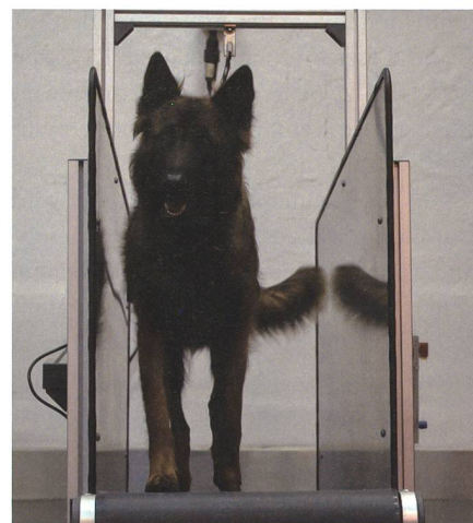
Bei einigen Hunden muss die Rückenmuskulatur zusätzlich gestärkt werden. Dafür werden die täglichen Spaziergängen mit einem Lauftraining am Laufband ergänzt.