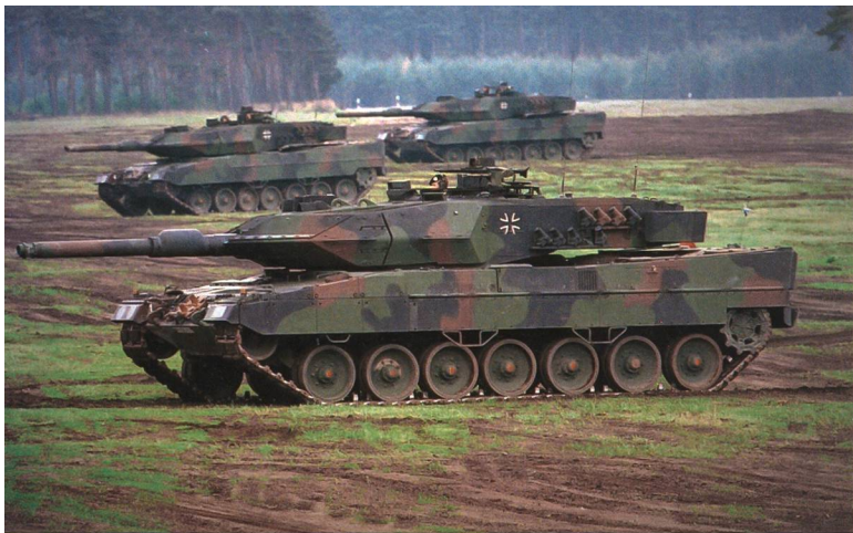
Die Ukraine bittet Deutschland um Kampfpanzer. Die Bundesregierung zögert. Ihr Argument: Die Ausbildung würde zu lange dauern.