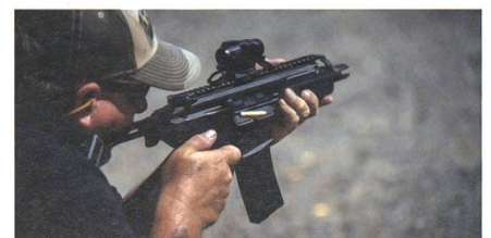
SIG McX Rattler für die Spezialkräfte.