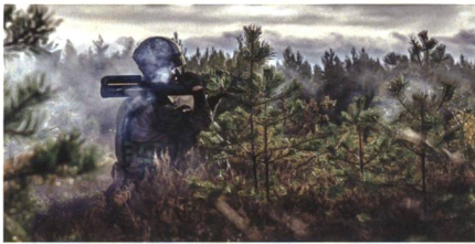
Zusätzliche Panzerabwehrwaffen des Typs M72 MK2 für Finnland.

Das finnische Verteidigungsministerium hat die Beschaffung weiterer leichter Panzerabwehrwaffen des Typs M72 MK2 Enhanced Capability Lightweight Anti-tank Weapon aus heimischer Fertigung bekannt gegeben. Die Waffen sollen ab 2023 ausgeliefert werden. Die in den finnischen Streitkräften als 66 KES 12 bezeichneten Panzerabwehrhandwaffen werden von Nammo Lapua Oy in einem Gesamtwert von 58 Millionen Euro geliefert. Die Finanzierung erfolgt laut Verteidigungsministerium aus einem Nachtragshaushalt, welcher im Zuge der gestiegenen Bedrohungslage durch den Ukrainekrieg die De-