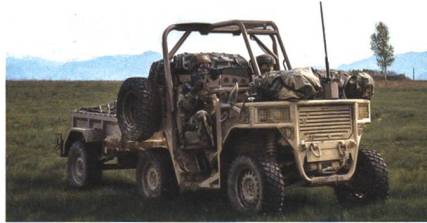
Leichtes Geländefahrzeug UNAC RIDER Fardier ATV.

Um die Mobilität der französischen Spezialkräfte- und Luftlandverbände zu erhöhen, hat die französische Beschaffungsbehörde DGA jüngst die Beschaffung der letzten 180 von insgesamt 300 geplanten Fardier-Fahrzeugen - auch als UNAC RIDER Fardier ATV bezeichnet - eingelei-