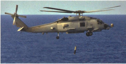
Weitere MH-60R-Seahawk-Helikopter für die Royal Australian Navy.

Sikorsky fertigt zwölf weitere MH-60R-Seahawk-Helikopter für die Royal Australian Navy. Die neuen Helikopter werden zum Festpreis im Rahmen des Foreign Military Sales Agreements der US-Regierung beschafft. Sie ergänzen die Flotte der