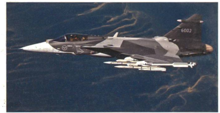
Gripen E mit Luft-Luft-Raketen Meteor und Iris.

Saab hat mit dem Gripen E eine Meteor-Lenkwanne erfolgreich abgefeuert und ins Ziel gelenkt, damit ist der Meteor-Flugkörper erfolgreich in die modernste Gripen-Variante integriert. Der erste Meteor-Testschuss von einem Gripen E erfolgte über dem Waffentestgelände im nordschwedischen Vidjel. Der Gripen E feuerte den radargelenkten Meteor-Flugkörper aus einer Höhe von 16 500 Fuss ab (5029 Meter) und hat laut Saab das anvisierte Ziel sicher getroffen. Die Meteor Lenkwaffe ist eine aktive radargesteuerte Luft-Luft-Ra-