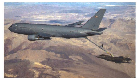
Luftbetankung einer F-35 durch eine KC-46A Pegasus.