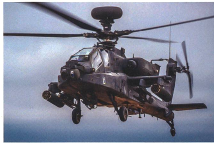
AH-64E für die polnischen Streitkräfte.

In erster Linie sollen sie der 18. mechanisierten Division zugeteilt werden.