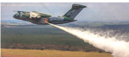
Erfolgreiche Flugversuche der KC-390 als Feuerlöschflugzeug.

Embraer hat die Testkampagne mit dem KC-390 als Feuerlöschflugzeug abgeschlossen, der Transporter kann dabei bis zu 11 300 Liter Löschwasser ablassen. Das modular aufgebaute Feuerlöschsystem (Modular Airborne Firefighting System II, MAFFS II) kann einfach in den Frachtraum des KC-390 Transporters installiert werden. Das MAFFS II von der US-Firma United Aeronautical Corporation besteht aus fünf Wassertanks und zwei Wasseraustrittsröhen, die durch die Seitentüren am Heck des Flugzeugs ragen. Bei der modu-