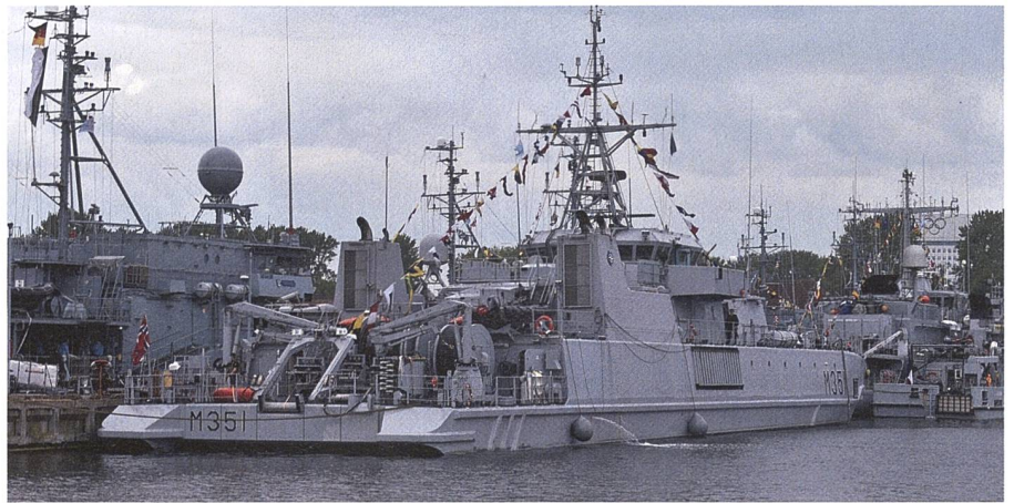
Der norwegische Minensucher «Otra» mit einem «waterjet»-Antrieb und einem eher ungewöhnlichen Rumpf, der für hohen Seegang wenig geeignet ist.

Wichtige Hafenzufahrten, die beispielsweise für die Heranführung von NATO-Verstärkungen dienen, sind nicht selten äusserst exponiert, wie beispielsweise jene von Klaipeda in Litauen und damit äusserst verwundbar.