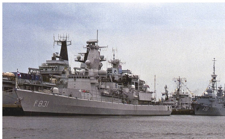
Die niederländische Fregatte «Van Amstel» hat mit anderen Einheiten nach der Übung «BALTOPS 23» im Hafen von Kiel festgemacht.

Die breite Öffentlichkeit Europas hat aber auch von der in etwa gleichzeitig stattfindenden und bis zum 23. Juni dauernden NATO-Übung «Air Defender 23» vor allem über Deutschland und Osteuropa Kenntnis genommen, welche als grösstes Luftmanöver seit dem Ende des Kalten Krieges unter deutscher Führung gilt und