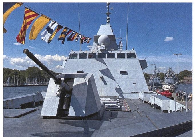
Das Vorschiff der modernen französischen Raketenfregatte «Auvergne» (Typ FREMM) mit einem 76 mm Geschütz und Startkanistern für Schiff-Luft und Schiff-Schiff-Raketen im Hafen von Kiel.