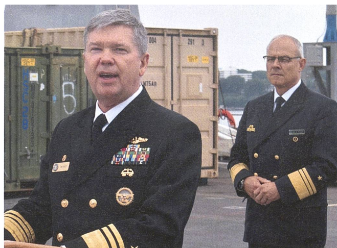
Vizeadmiral Thomas Ishee, Kommandant der 6. US Flotte, äussert sich auf dem Deck des Flaggschiffs USS «Mount Whitney» zum Übungsverlauf von «BALTOPS 23», rechts der Inspekteur der Deutschen Marine, Vizeadmiral Jan Kaack.

vor allem die Verstärkung des Kontinents mit Fliegerverbänden aus den USA beinhaltete. Dabei kamen insgesamt 250 Flugzeuge aller Art aus 25 Nationen zum Einsatz. Allein von der Luftwaffe der amerikanischen Nationalgarde flogen an die 100 Maschinen über den Atlantik.