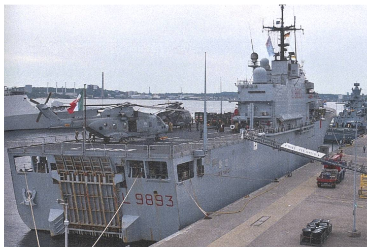
An der Übung «BALTOPS 23» hat auch der italienische Helikopterträger «San Marco» mit einer verstärkten Marineinfanterie-Kompanie an Bord und mit zwei NH-90 Helikoptern teilgenommen.