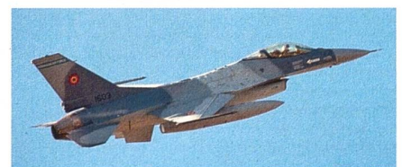
Rumänische F-16 sollen durch F-35 ergänzt werden.