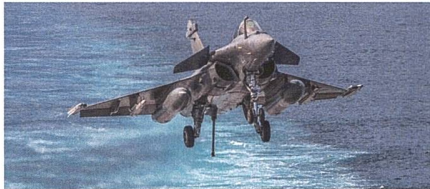
Rafale M neues Trägerflugzeug.

Nachdem die indische Luftwaffe bereits 36 Rafale-Kampffjets im Einsatz hat, setzt auch die indische Marine neu auf den französischen Fighter. Indien hat für ihre See-streitkräfte bei dem französischen Flug-