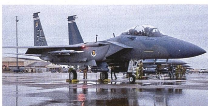
Indonesien will F-15EX beschaffen.

Indonesien hat mit Boeing eine Kaufabsichtserklärung über vierundzwanzig F-15EX Eagle unterzeichnet, die US-Regierung muss das Geschäft noch bewilligen. Für Boeing wäre es ein wichtiges Geschäft für die F-15 Eagle, diese wird seit fünfzig Jahren im ehemaligen McDonnell Douglas Werk St. Louis gebaut. Es wird davon ausgegangen, dass die Vereinigten Staaten von Amerika den Deal durchwinken werden, die US Defense Cooperation Security Agency hat bereits im Februar 2022 einem möglichen Foreign Military Sales