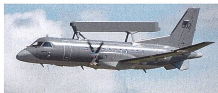
Frühwarnflugzeug Saab 340 für Polen.

Das polnische Verteidigungsministerium hat zwei Saab 340 Frühwarnflugzeuge bestellt. Laut Saab entspricht der neue Auftrag einem Wert von 600 Millionen Kronen, der Vertrag soll in den Jahren 2023 bis 2025 abgewickelt werden. Polen kauft dabei zwei Saab 340 Turbopropellerflug-