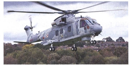
U-Boot-Bekämpfungs- und SAR-Hubschrauber AW101.

Die Auslieferungen der vier Leonardo AW101 an Polen hat begonnen. Die Hubschrauber sind für die U-Boot-Bekämpfung und SAR-Dienste als Ersatz der Mi-14 vorgesehen. Der Vertrag wurde im April 2019 mit der Wytwórnia Sprzętu Komunikacyjnego «PZL-Świdnik» SA (Tochtergesellschaft von Leonardo in Polen) geschlossen, die für Lieferung sowie ein Logistik- und Ausbildungspaket zuständig ist. Der Vertragswert beträgt 373 Mio. Euro, die Auslieferungstermine der Hubschrauber waren ursprünglich ab Ende