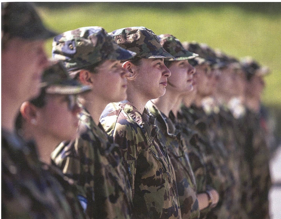
Für Frauen soll der Orientierungstag in Zukunft obligatorisch werden (Symbolbild).

für ein ausgewogenes Drei-Säulen-Prinzip, bestehend aus Militär, Zivilschutz und Zivildienst. Nur – und das ist der Haken am Ganzen – ist dieses für die Schweiz taugliche und bewährte Prinzip wegen des heute überdimensionierten Zivildienstes völlig aus der Balance geraten. Das ist nur schon daran klar erkennbar, dass es heute rund 55 000 Zivis gebe – Tendenz weiter steigend. Damit entwickelt sich das Heer der Zivis immer mehr zu einer Art «Schattenarmee» von nicht nur beruflich, sondern vielfach auch militärisch gut ausgebildeten Leuten, die sich der Dienstpflicht entzogen haben und die Armee zahlenmässig noch überholen könnten. Somit wird das Milizsystem ad absurdum geführt.