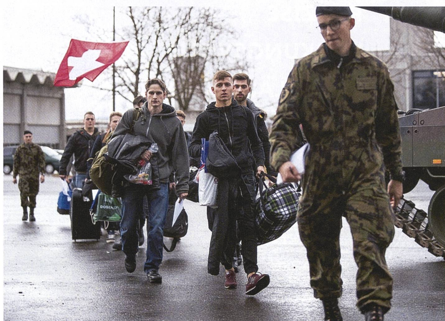
Jahr für Jahr gehen immer mehr wehrtaugliche Männer der Armee verloren. (Symbolbild).