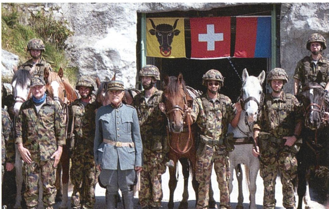
Die Darbietungen des Trains boten auch dieses Jahr viele spannende Einblicke in das Teamwork «Mensch und Pferd».