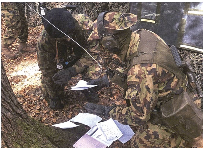
Besprechung des Einsatzes.

Spillmann: Im GAD (Grundausbildungsdienst) findet dies weniger häufig statt - und wenn, dann meist supponiert durch die Übungsleitung, also Berufsmilitärs, welche eine Rolle spielen. Im FDT (in den WKs) kommt dies öfter vor. Dort wird zum