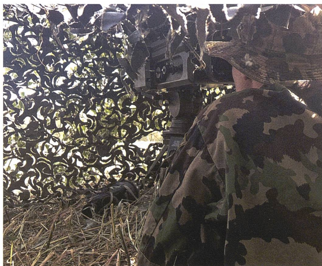
Beobachtungsposten mit WBG.