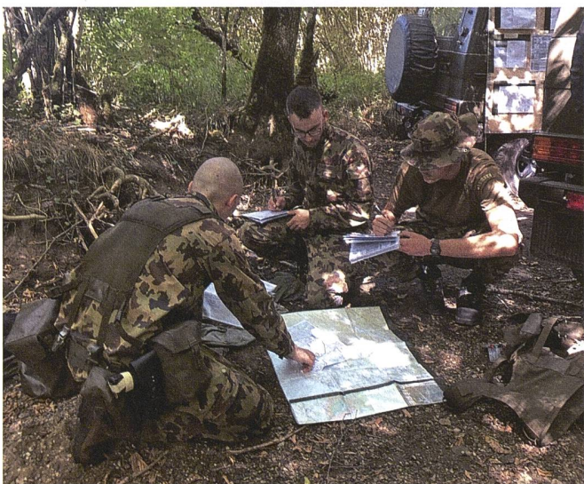
Befehlsausgabe an der Karte.