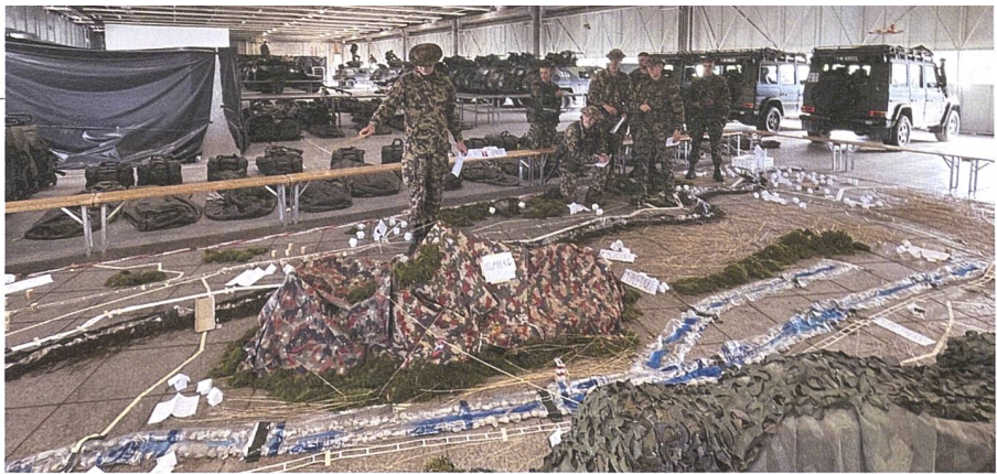
Befehlsausgabe am Geländemodell.

Spillmann: Entscheidend sind funktionierende Uem Netze, so dass die Meldung vom Aufkl möglichst direkt zum entsprechenden Nachrichtenoffizier zur Auswertung gelangt. Mit der Einführung von TASY und TKA in den nächsten Jahren