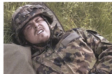
Die Drillpiste hatte es in sich. Der Rapper musste sie frühzeitig abbrechen.