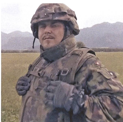
Rapper EAZ tauschte für einen Tag sein Bühnenoutfit mit dem TAZ.

Das Manövrieren des grossen Fahrzeuges verlief nicht sonderlich nach Plan, zumal der frischgebackene Rekrut im Jahr 2014 seinen Führerschein abgeben musste. Diese Aufgabe hat er nicht geschafft,