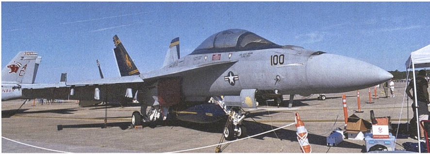
Diese F/A-18F «Super Hornet» der Fighter-Attack Squadron 32 gehört zum Marineflieger-Geschwader 3 auf der «Ike».

Flugzeugträgers etwas Privatsphäre verschafft, die er aber nur wenig und meist nur für Repräsentationszwecke nutzt. Sonst «wohnt» er in seiner wesentlich kleineren Kabine, die unmittelbar hinter der Navigationsbrücke liegt und die es ihm erlaubt, innert wenigen Sekunden dort eingreifen zu können, falls dies die Lage erfordert.