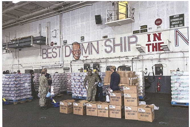
Auf dem Hangardeck der «Ike» türmen sich die Lebensmittel, die vor der Einsatzfahrt des Trägers an Bord gebracht werden. Für die rund 5000 Seeleute an Bord sind gewaltige Mengen nötig.

Arbeit mit einem Auftrag und einem Zweck bzw. Sinn, sowie (3) auf einen Willen, erfolgreich zu sein.