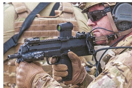
Heckler & Koch MP7 für die litauischen Streitkräfte.