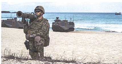
Ein japanischer Soldat mit dem schwedischen Carl Gustaf.

Saab hat von den japanischen Selbstverteidigungskräften (JGSDF) einen Auftrag über die Lieferung des tragbaren Mehrzweckwaffensystems Carl-Gustaf M4 erhalten. Der Auftrag umfasst mehr als 300 Systeme, die Auslieferung ist für das Jahr 2025 geplant. Carl-Gustaf ist ein tragbares Mehrzweckwaffensystem, das durch seine grosse Auswahl an Munitionstypen eine hohe taktische Flexibilität bietet. Es eignet sich sowohl für die Bekämpfung von ge-