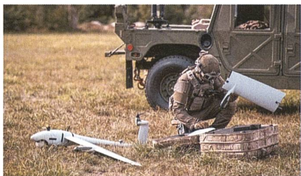
Vector VTOL für die Spezialkräfte.

Im Vertrag ist zudem die Ausbildung des Bedienpersonals vereinbart. Mit der Beschaffung des Aufklärungssystems FALKE erhalten die Spezialkräfte ein für ihr Einsatzspektrum optimiertes Aufklärungssystem, welches den Anforderungen hin-