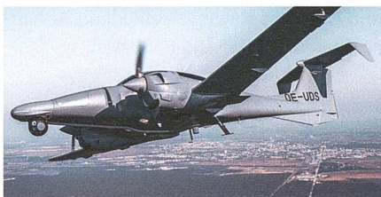
Überwachungsflugzeug Diamond DA62MPP für Nigeria.

Die nigerianische Luftwaffe (NAF) hat kürzlich die zweiten beiden von insgesamt vier Überwachungsflugzeugen des Typs DA62MPP von Diamond Aircraft aus Wiener Neustadt erhalten. Nach dem Zulauf der beiden jüngsten Maschinen verfügt die nigerianische Luftwaffe nun über