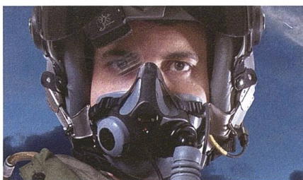
Helmvisier Thales Scorpion.

Wie Thales bekannt gegeben hat, hat das Unternehmen von Korea Aerospace Industries (KAI) einen Auftrag zur Ausstattung der von Polen bestellten FA-50-Kampfflugzeuge mit dem sogenannten