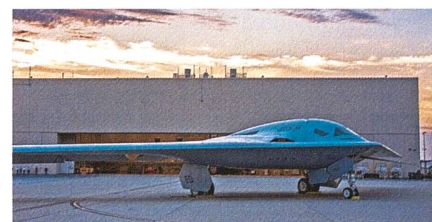
Neue Perspektive auf die B-21 Raider.