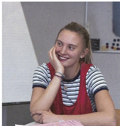
em Gesamtbild einer Person, in das viele