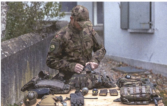
Total 148 Ausrüstungsgegenstände lassen sich zahlreich kombinieren und an die Bedürfnisse des Trägers anpassen.