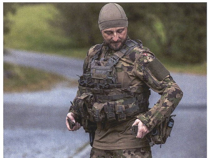
Splitterschutzweste ade: Das neue Schutzsystem besteht aus einem Plattenträger und einer Schutzweste.