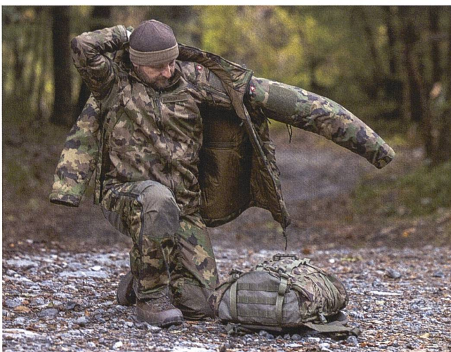
Zwiebel-Prinzip: Die Bekleidung ist in sieben Schichten unterteilt.

Die Beschaffung des MBAS für 348 Millionen Franken wurde vom Parlament mit der Armeebotschaft 2018 bewilligt. Die geschätzte Nutzungsdauer beträgt 25 Jahre. ✚