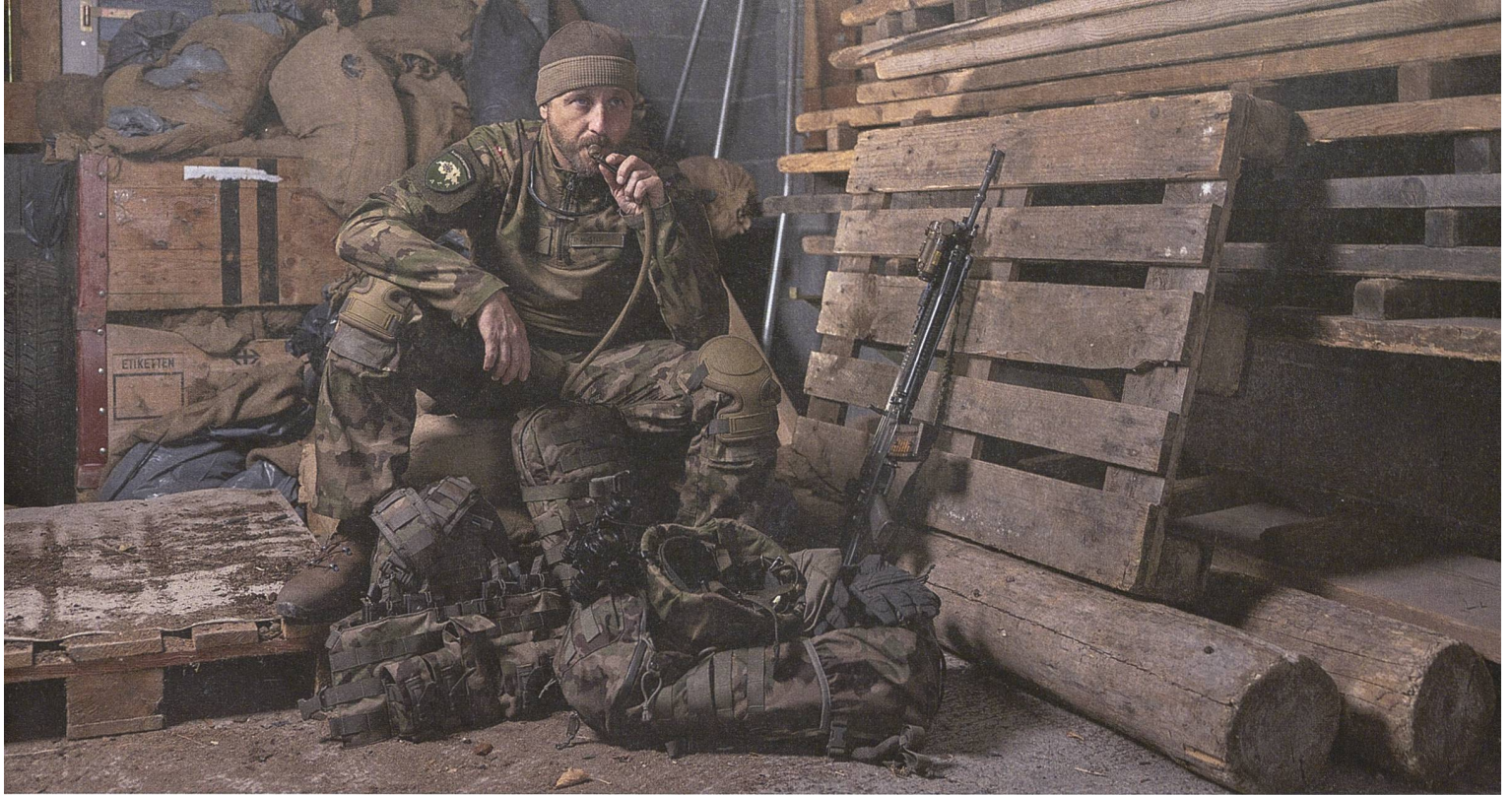
Das neue Bekleidungssystem besteht aus insgesamt 33 neuen Komponenten, darunter ein Trinksystem.