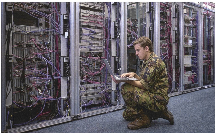
Im Cyber Lehrgang bildet die Schweizer Armee Cyber Spezialistinnen und Spezialisten aus.

Der Bericht ist ein Beweis dafür, dass die Verteidigung im Cyberraum gestärkt werden muss. Ab dem 1. Januar 2024 wird das Kommando Cyber durch den vom Bundesrat zum Divisionär ernannten Oberst i GSt Simon Müller operationell funktionieren. Die derzeit existierende Führungsunterstützungsbasis (FUB) wird in ein militärisches Kommando Cyber weiterentwickelt, welches sich auf die einsatzkritischen IKT (Informations- und Kom-