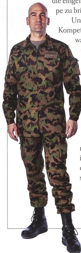
Korpskommandant Thomas Süssli Chef der Armee

Denn es geht darum, uns auf die Bedrohungen der 30er-Jahre auszurichten. Es geht darum, die Armee für ihren Kernauftrag zu befähigen. Es geht darum, die Verteidigungsfähigkeit zu stärken.