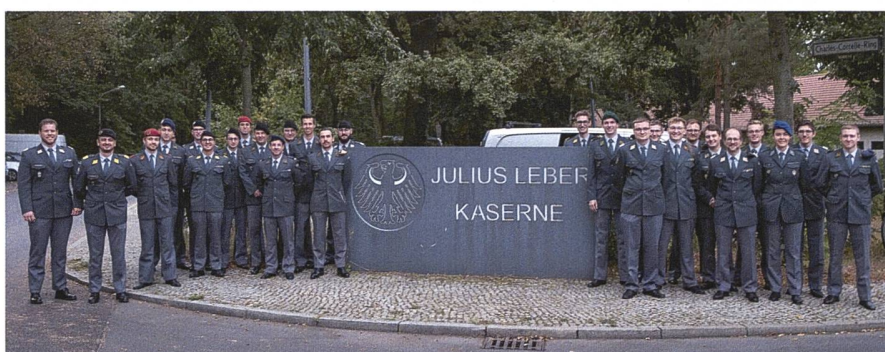
Ein Rekord: 28 Mitglieder waren bei der diesjährigen «U STORIA» dabei.