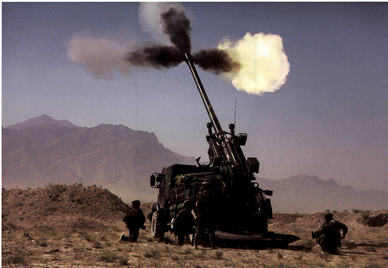
Die CAESAR-Haubitze im Einsatz in Afghanistan. In der Version 8x8 sollen alle Geschütze Dänemarks nun in die Ukraine gespendet werden.

Selbst wenn der Hersteller Kapazitäten zur Fertigung von neuen Haubitzen