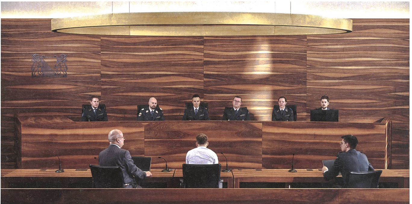
Die Militärjustiz ist die militärische Strafverfolgungs- und Gerichtsbehörde der Schweiz. Sie beurteilt die der Militärstrafgerichtsbarkeit unterworfenen strafbaren Handlungen gemäss dem Militärstrafgesetz