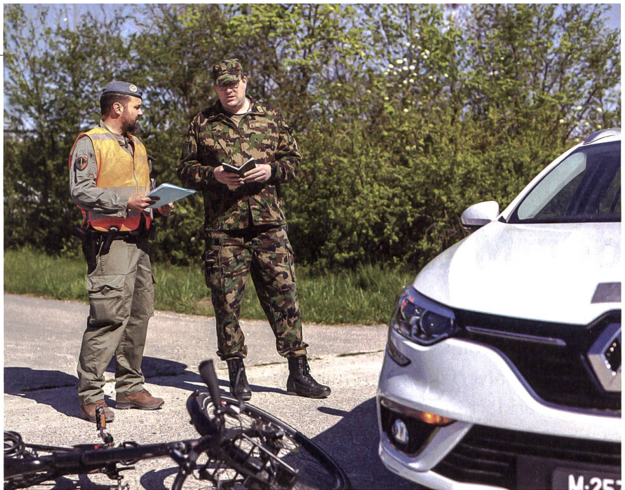
Mehrfach wollten Armeegeegner bisher die Militärjustiz abschaffen. Bereits 1916 wurden erste Versuche unternommen.

Denn dank des militärischen Know-hows der Militärgerichte, in denen alle Grade und auch Nicht-Juristen vertreten sind, können die Verfahren effizient und überzeugend abgehandelt sowie in aller