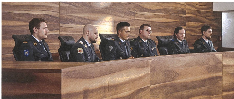
Die Hauptverhandlungen vor den Militärgerichten sind öffentlich.

Der Untersuchungsrichter schliesst die Voruntersuchung in der Regel mit einer Schlussverfügung ab. Der Auditor entscheidet über den Fortgang des Verfahrens. Er hat drei Möglichkeiten: Anklageerhebung, Einstellung des Verfahrens (mit oder ohne disziplinarische Bestrafung) oder Erlass eines Strafmandats. Zudem können der Auditor, der Beschuldigte sowie der Geschädigte Ergänzung der Voruntersuchung durch den Untersuchungsrichter verlangen.