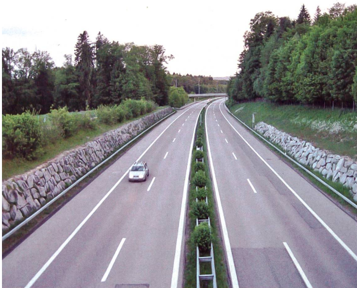
Die Trasse der Autobahn A7 im Raum Oberstücken vor dem Sprengobjekt über das Lippoldswiler Tobel wurde tiefergelegt und die Seitenwände des so entstandenen «Panzergrabens» wurden mit Felsblöcken verkleidet, damit ein seitliches Ausbrechen ins offene Gelände nicht möglich ist.