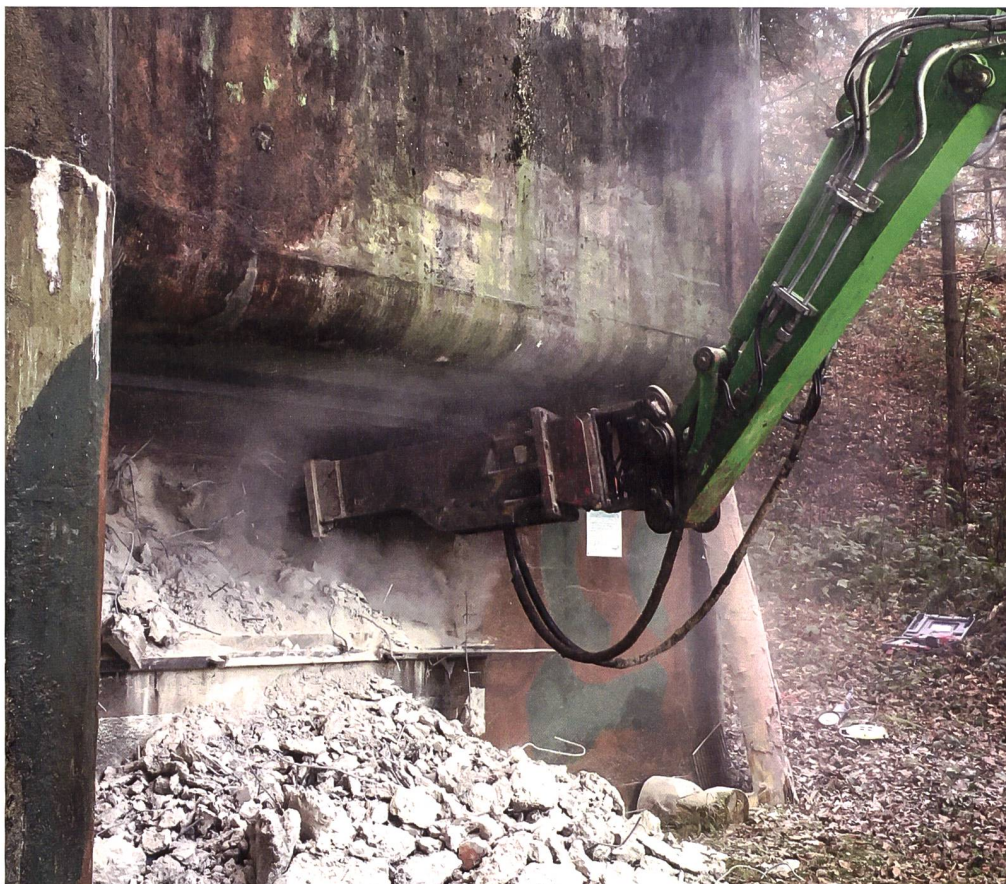
Einige Mitglieder dieses Vereins sind sogenannte Bunkergötti, die viel Zeit und Geld für die Wiederherstellung des originalen Zustands «ihres» Bunkers investieren. Sie vervollständigen auch die Ausrüstung oder müssen sogar zubetonierte Schiessscharten wieder öffnen.

In der Schriftenreihe der Bibliothek am Guisanplatz können Sie auch Band Nr. 27 «Planung und Bau des Festungsgürtels Kreuzlingen», verfasst von Peter Hofer, herunterladen und sich in die Geschichte vertiefen. +