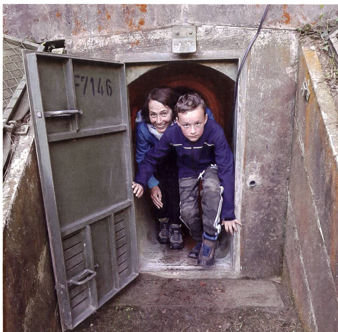
Führungen durch die Anlagen des Festungsgürtels Kreuzlingen stossen bei Schulen, Vereinen und Betrieben auf reges Interesse. Programm und Termine werden individuell den Wünschen der Besucher angepasst.