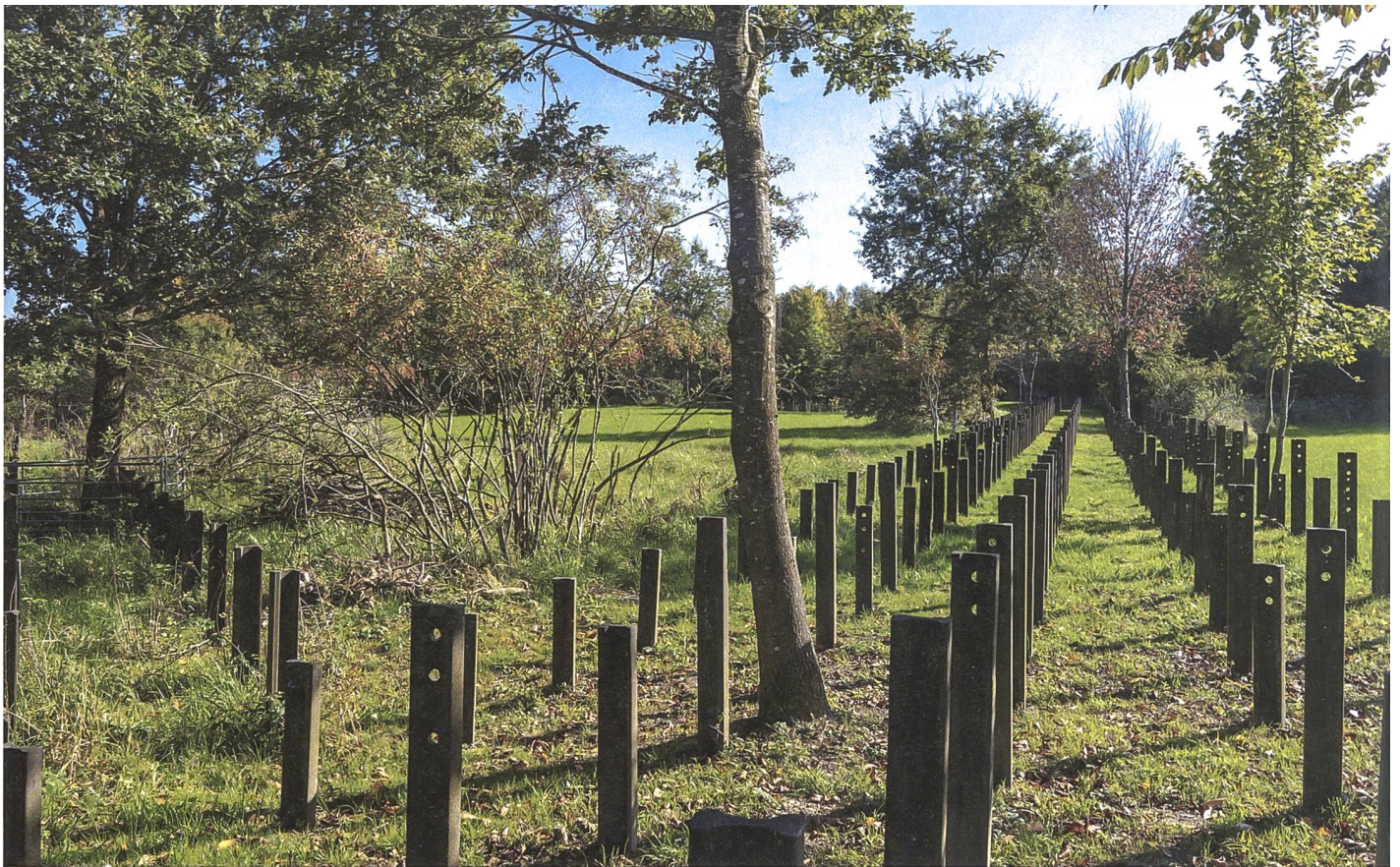
Hier im Bild: ein vierreihiges Hindernis.

Als Unikat muss der Bahndamm-bunker beim Bahnhof Lengwil erwähnt werden: Der nördliche und der südliche Bunker sind durch einen unterirdischen Gang unter der Bahntrasse miteinander verbunden.