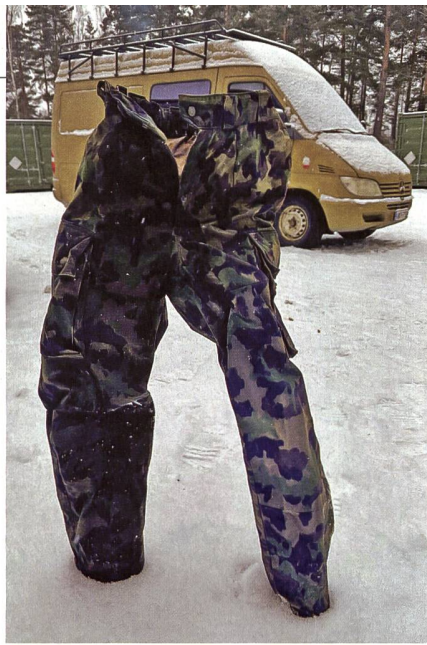
Nach dem Eisbad haben wir unsere Uniform über Nacht gefriergetrocknet.

Der Einbruch wird mitsamt Kleidung, Rucksack, Skiern und Skistöcken simuliert und der Verantwortliche des Kurses demonstriert uns das Vorgehen. Bricht man