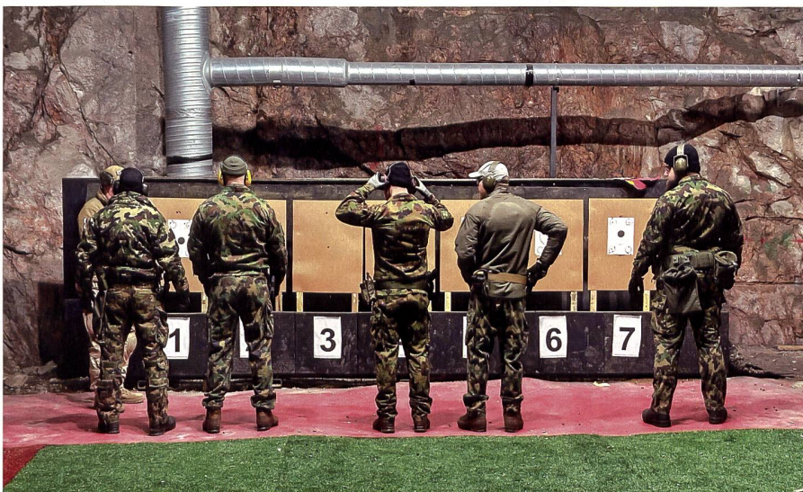
Eine etwas andere Schiessausbildung: Wir können unsere Fähigkeiten verbessern.

Per Reisebus werden wir zum Basislager des Kurses, nördlich von Sysmä, transportiert.