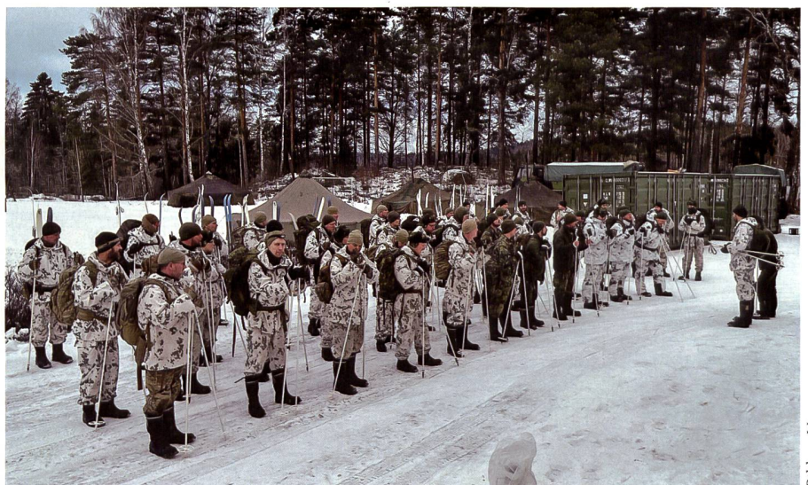
Bei der Orientierung über die bevorstehende Lektion. Im Hintergrund sind unsere Zelte zu sehen.

Deshalb wartet bereits ein Taxi auf uns, welches uns nach kurzer Fahrt, etwas