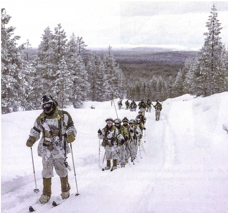
Die MPK bietet über den Winter viele Kurse an. Hier im Bild: Teilnehmer der U.S. Army.

ausserhalb der Stadt, an einer Tankstelle absetzt.