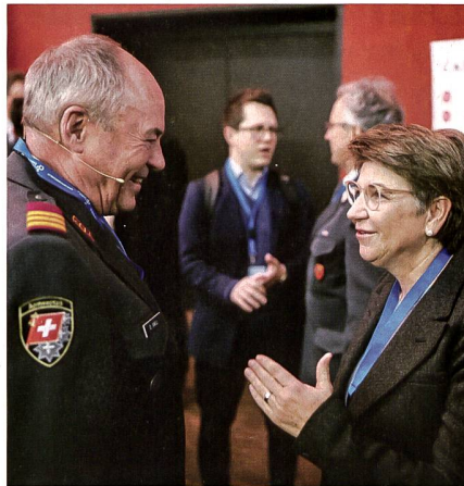
SOG Präsident Knill im Gespräch mit Bundesrätin Amherd.

«All dies immer unter Einhaltung der Neutralitätsrechtlichen Pflichten. Das heisst: keine Verpflichtungen für eine kollektive Verteidigung einzugehen», hielt Bundesrätin Amherd fest.