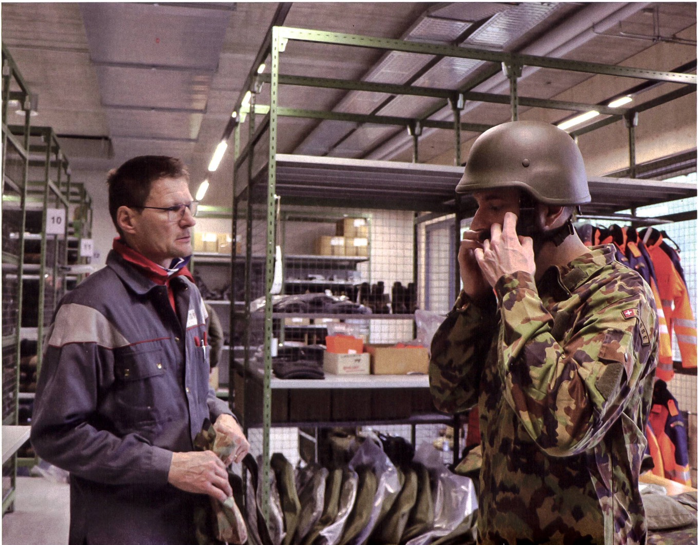
Viele Gegenstände werden gefasst: Mit dem MBAS-Ausrüstungssystem wird die Logistik bald noch komplexer werden.