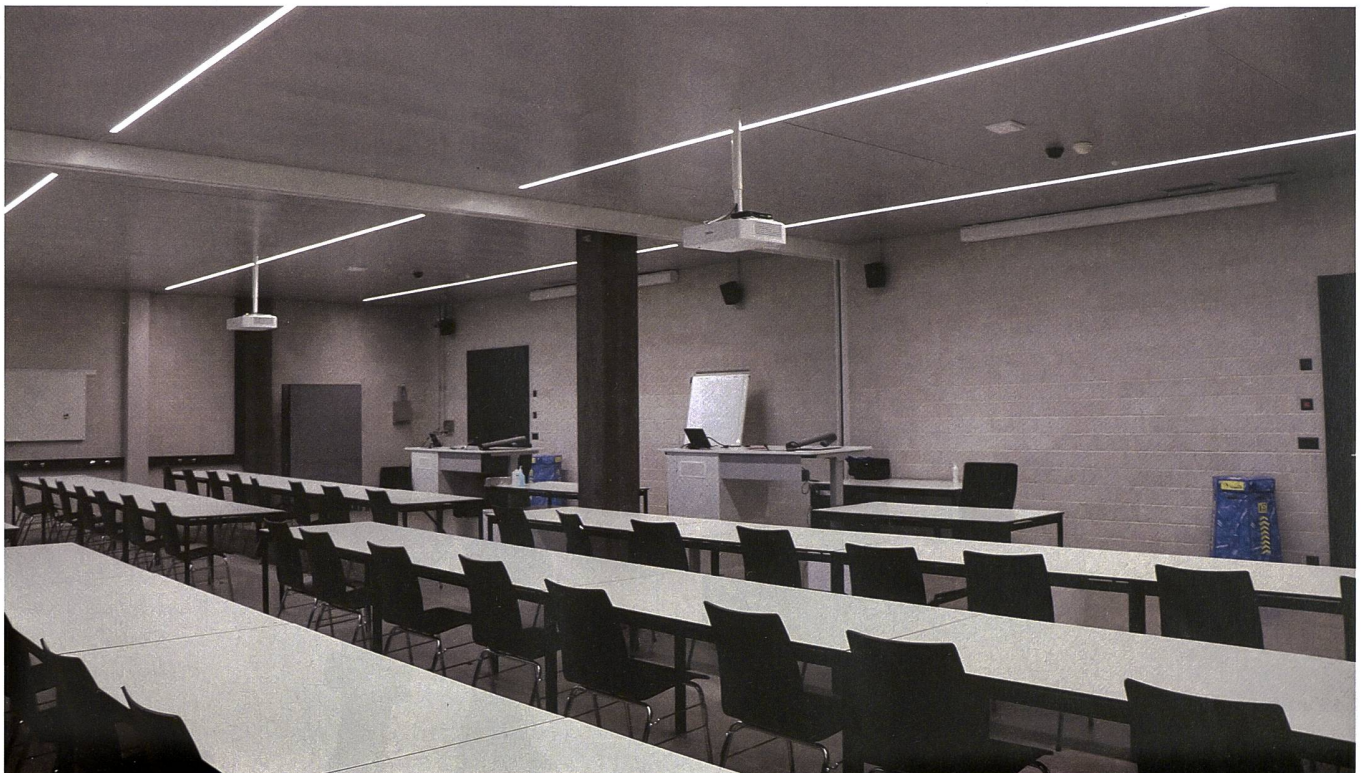
Neue Ausbildungsräume. Nun ist genug Platz da, um die Ausbildung innerhalb des Waffenplatzes durchzuführen.

Was bald nicht mehr abgegeben wird, sind die sogenannten «Beingümmeli». Denn der Kampfstiefel KS 90 gehört be-