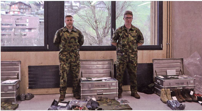
Der SCHWEIZER SOLDAT war bei der Materialfassung des SWISSCOY Kontingent 48 im Februar 2023 dabei.