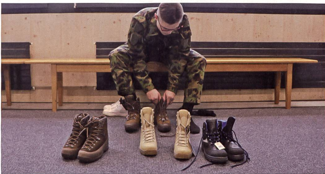
Am Schuhwerk soll es nicht mangeln. Hier auf dem Bild sind die verschiedenen Kampfstiefel zu sehen, die für den Einsatz im Kosovo gefasst werden. Bei den 3. Stiefeln von links handelt es sich um Schuhe mit Stahlkappen für die Geniesoldaten.