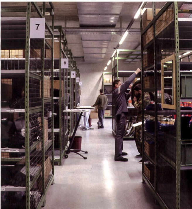
Moderner und übersichtlicher. Im Vergleich zum alten Zeughaus kann in der neuen Retablierungsstelle wesentlich komfortabler und effizienter gearbeitet werden.