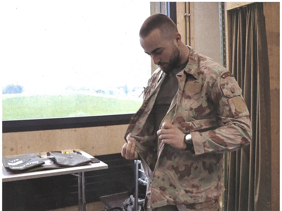
Anprobe des Tarnanzuges für den Sommer. Dieser wird nur für Friedensförderungseinsätze abgegeben.

Der wohl schwerste Gegenstand ist natürlich die Schutzweste inklusive ihrer