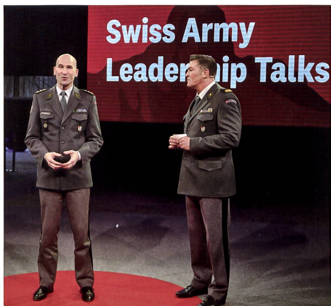
Der Chef der Armee war der Gastgeber der Leadership-Konferenz auf dem Waffenplatz Thun.