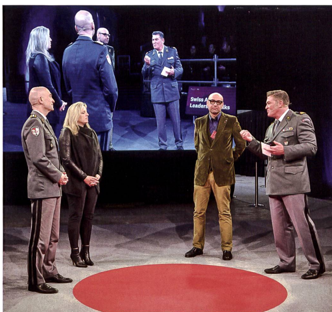
Im Anschluss an die Vorträge hatte das Publikum die Möglichkeit, Fragen zu stellen.