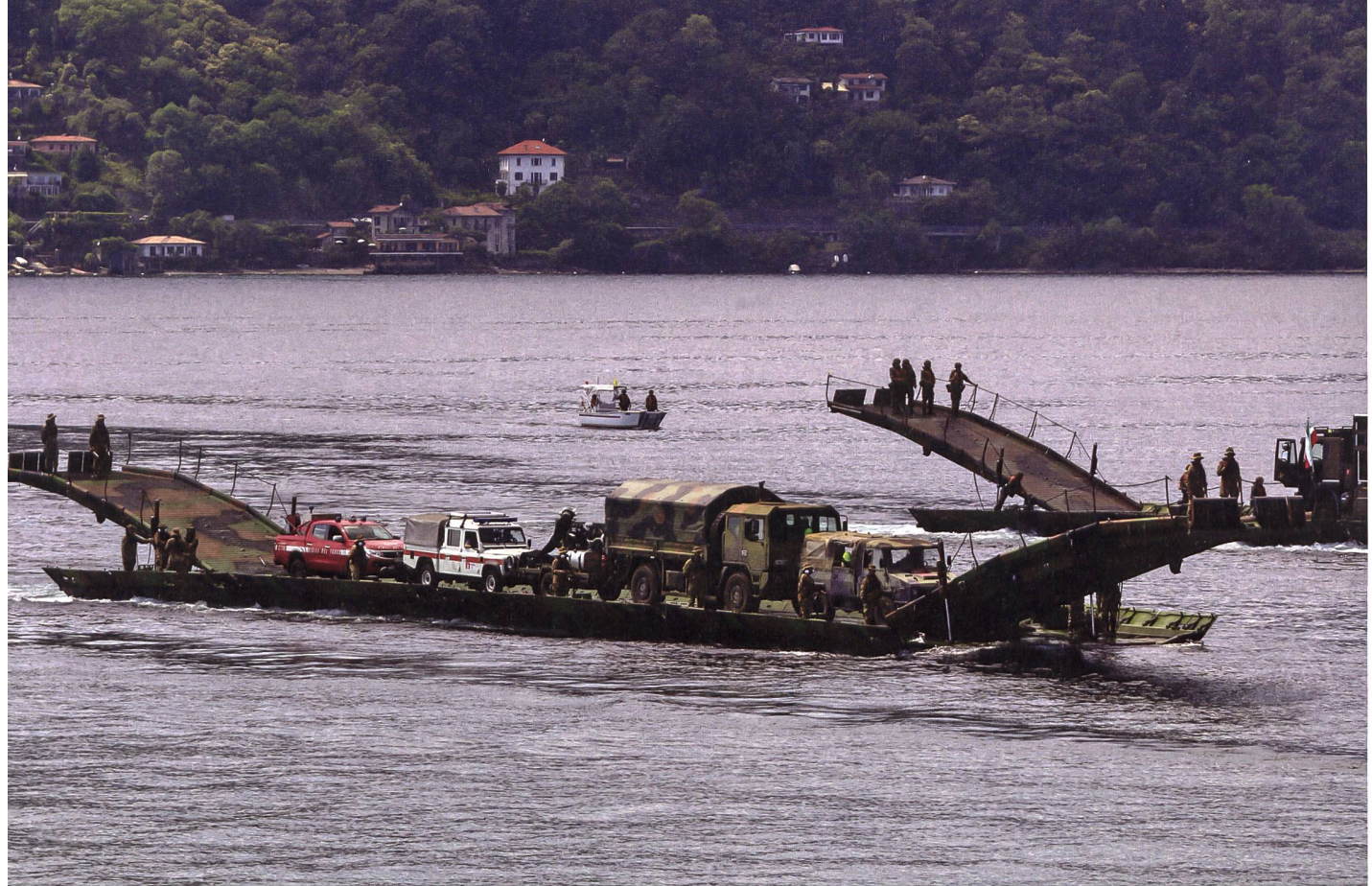
Übung ODESCALCHI: So nahe wie möglich an der Realität üben und Vorausplanungen und Konzepte validieren.