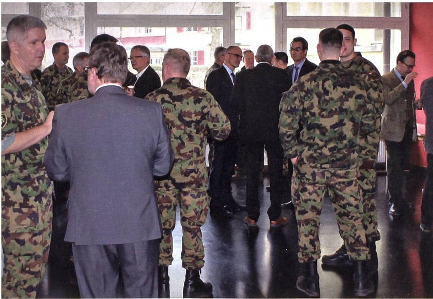
Die Teilnehmenden nutzten in der Pause die Gelegenheit, um das Netzwerk zu pflegen und weiter auszubauen.