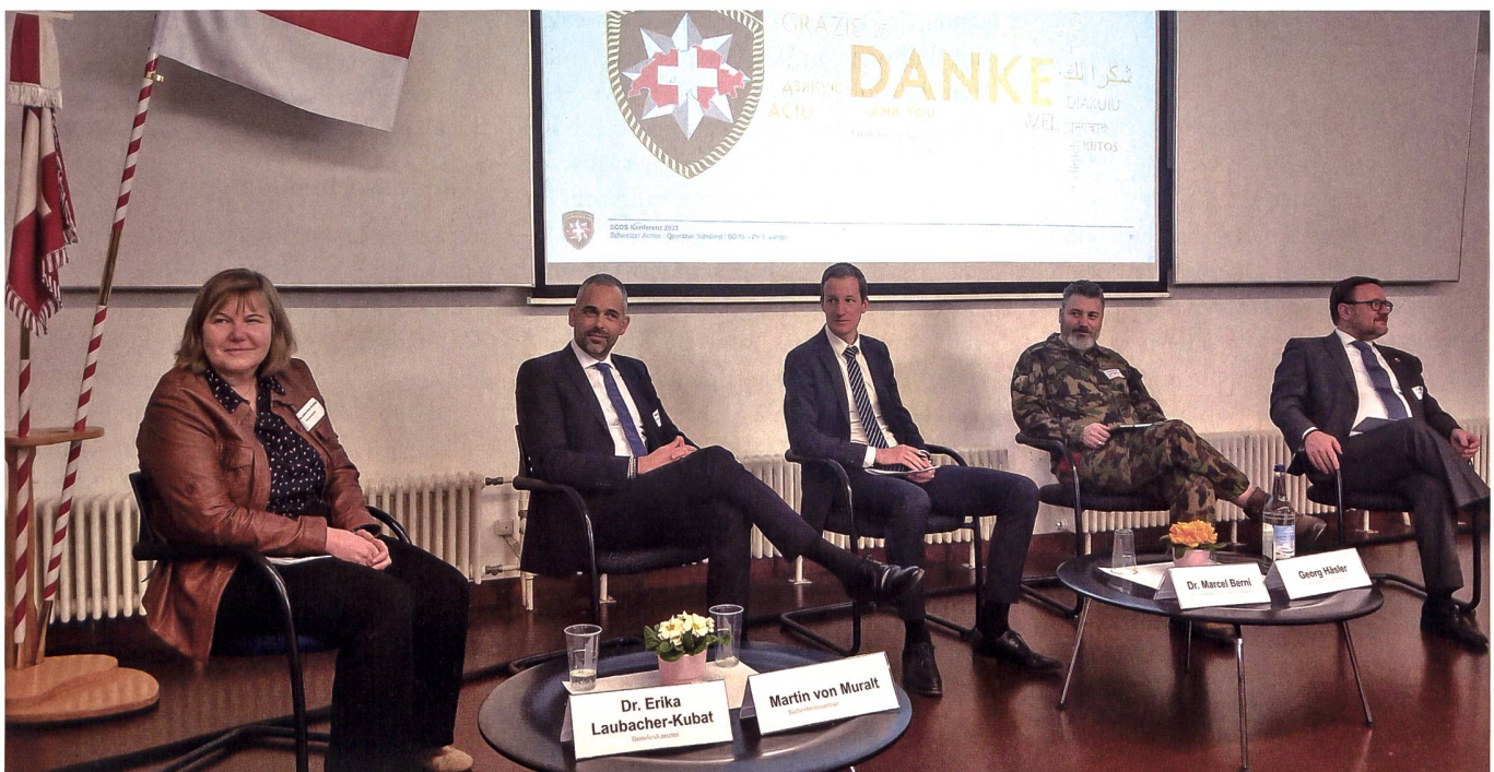
Einigkeit auf dem Podium: In Krisen muss man seine Partner kennen.

«Wir richten unser Tun auf die Stärkung und Weiterentwicklung des Gesamtsystems Armee aus.»