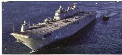
Erster Flugzeugträger für die Türkei.

Die Türkei hat am 10. April ihr bisher grösstes Kriegsschiff in Dienst gestellt. Mit einer Zeremonie auf der Sedef-Werft in Istanbul wurde der Helikopterträger TCG Anadolu offiziell in Dienst gestellt. Die TCG Anadolu soll dabei der erste Flugzeugträger der Welt sein, welcher ein Luftgeschwader beherbergt, das überwiegend aus unbemannten Flugzeugen (UAVs) besteht. Das Schiff, das nun zum türkischen Flaggschiff wird, soll über eine Deckkapazität für zehn Helikopter und elf UAVs sowie eine Hangarkapazität für 19 Helikopter und 30 UAVs verfügen. Bei der feierlichen Indienststellung der TCG Anadolu wurden auf dem Flugdeck neben vier Helikoptern eine bewaffnete Drohne Bayraktar Bay-