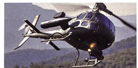
Airbus H125 wird bewaffnet.