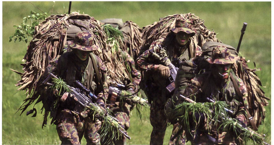
Die Späher müssen ausserordentlich fit sein – denn das Scharfschützengewehr und die gesamte Ausrüstung wird immer auf dem Rücken getragen!

Oder wie es Kommandant Stoller so schön sagte: «Die Ustü-Kompanie ist für mich wie eine Familie. In einer Familie wird manchmal auch gestritten. Das ist nicht weiter schlimm, weil alle wissen, auf was es am Ende ankommt. Nämlich, dass wir als Einheit zusammenstehen.» +