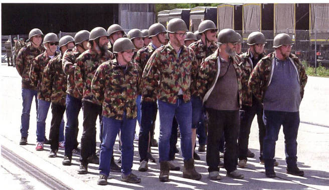
Väter und Söhne bei der Zugschule: Die Papis haben ihre Aufgabe wirklich gut gemeistert.