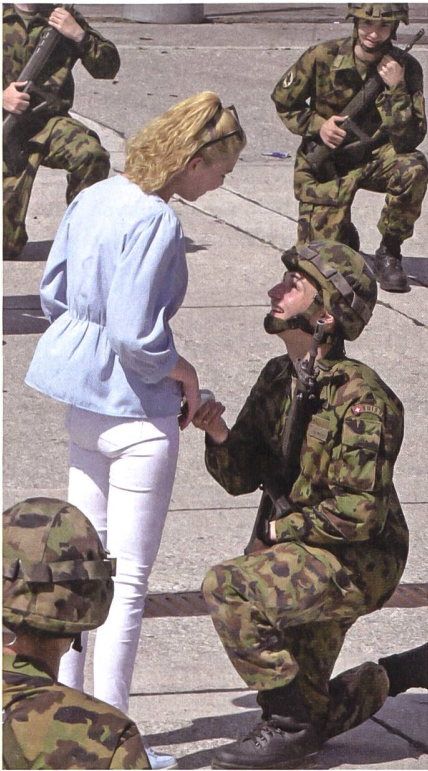
Ein Heiratsantrag der besonderen Art.