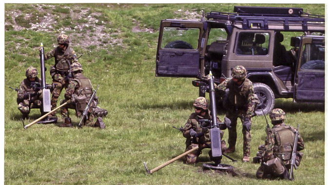
Die neuen Mörser 19 stellten die Soldaten vor einige Herausforderungen. Doch am Besuchstag haben die Vorführungen einwandfrei funktioniert.