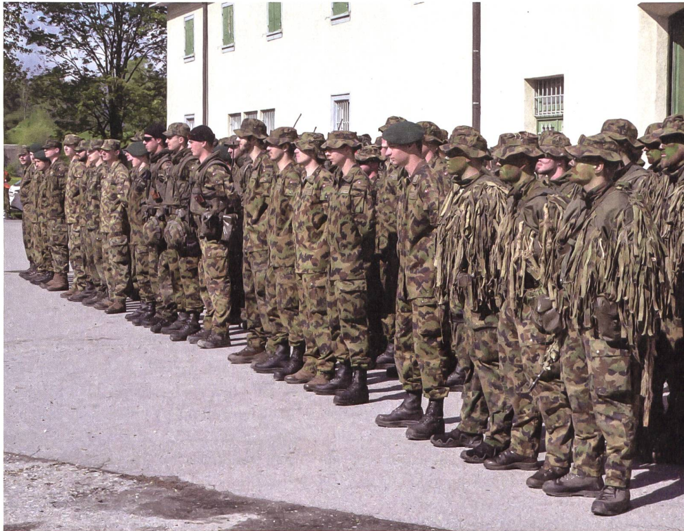
Die Unterstützungskompanie präsentiert sich stolz vor den Angehörigen.